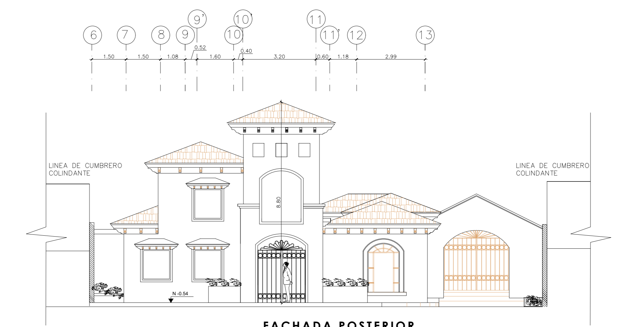
FACHADA POSTERIOR ESCALA: 1:100