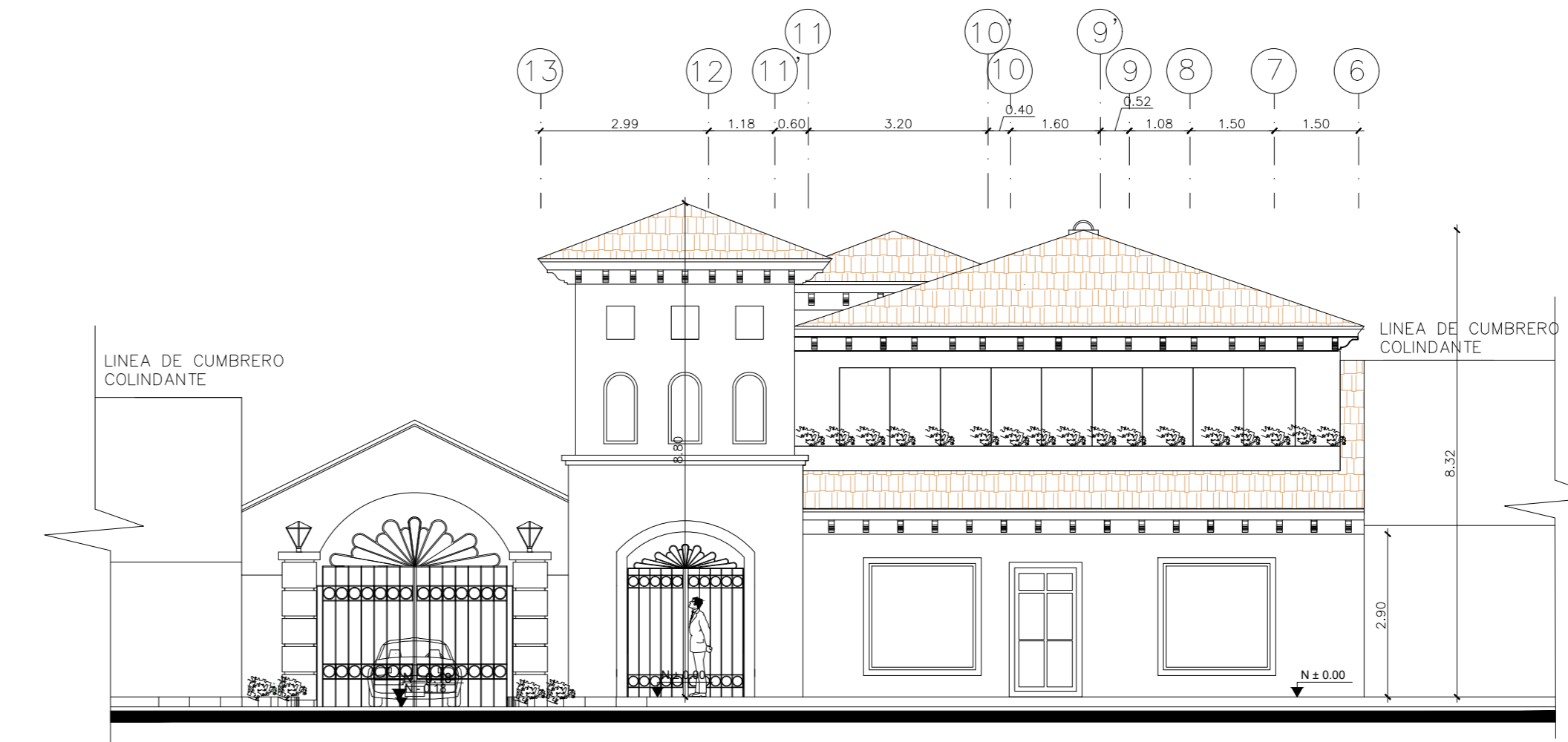
FACHADA FRONTAL ESCALA: 1:100