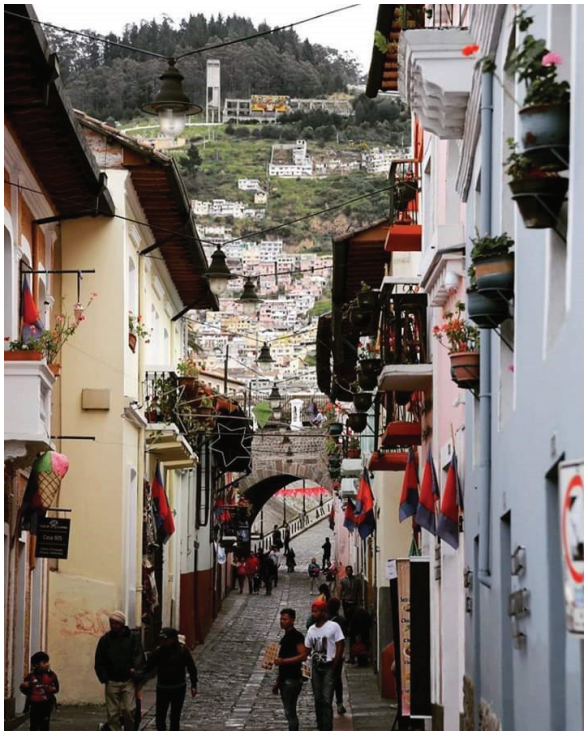
Entorno inmediato: La Ronda

De igual manera, la centralidad urbana del lugar de intervención y la proximidad a lugares de alto atractivo turístico, requieren de la presencia de un elemento de alojamiento de condiciones de confort y calidad operacional que cubra la de demanda nacional e internacional, mismo que resultaría de mucha importancia e interés.