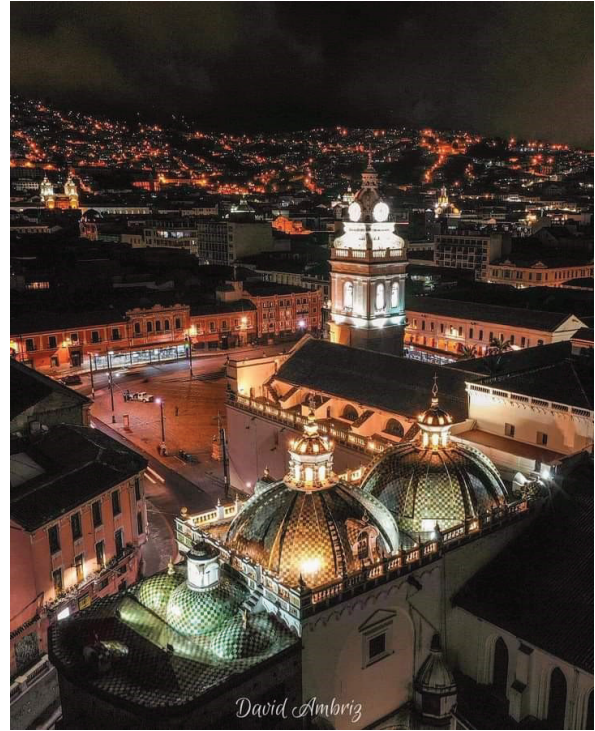
Entorno inmediato: Santo Domingo

Todas estas actividades y usos, coherentemente interrelacionadas, generarían un importante elemento arquitectónico que, en un armonioso esquema funcional, irían generando un organizado y constante recorrido entre espacios y usos. Todo esto desarrollado en el rescate de esquemas originales, con volumetrías y arquitectura propia del sector, señalando un dinamismo y evolución coherente entre el Quito Colonial y vernáculo con el Quito Contemporáneo.