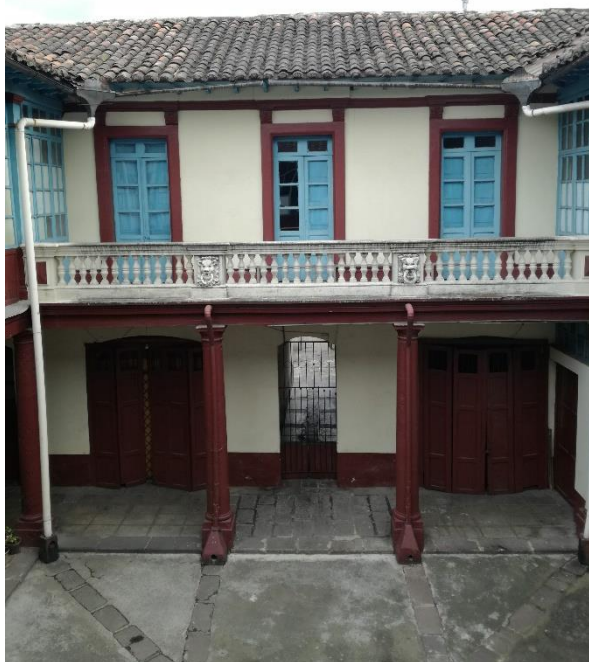
F_03 N+8.18. Fachada interna sur, patio central