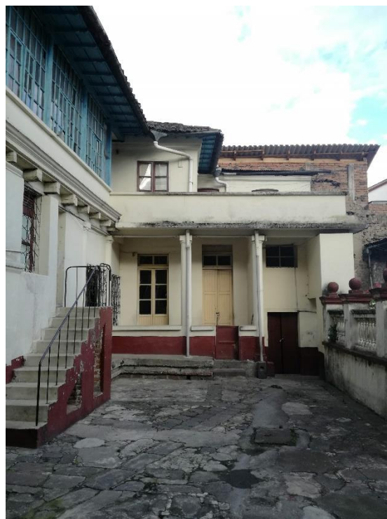
F_04 N+7.95. Fachada interna oriental, patio posterior