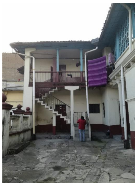
F_05 N+7.95. Fachada interna occidental, patio posterior.