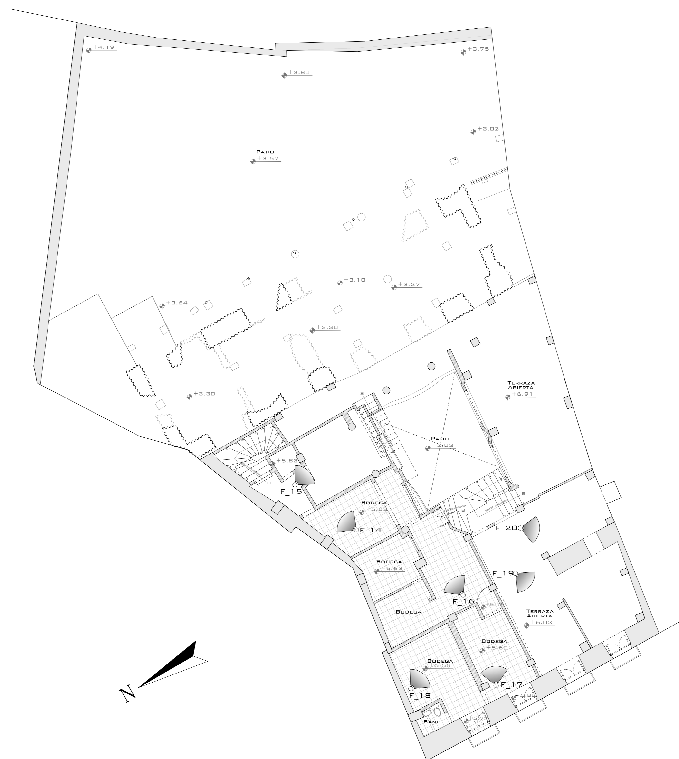
BLOQUE B MEMORIA FOTOGRAFICA NIVEL +5.63/+6.91 ESC: 1 100