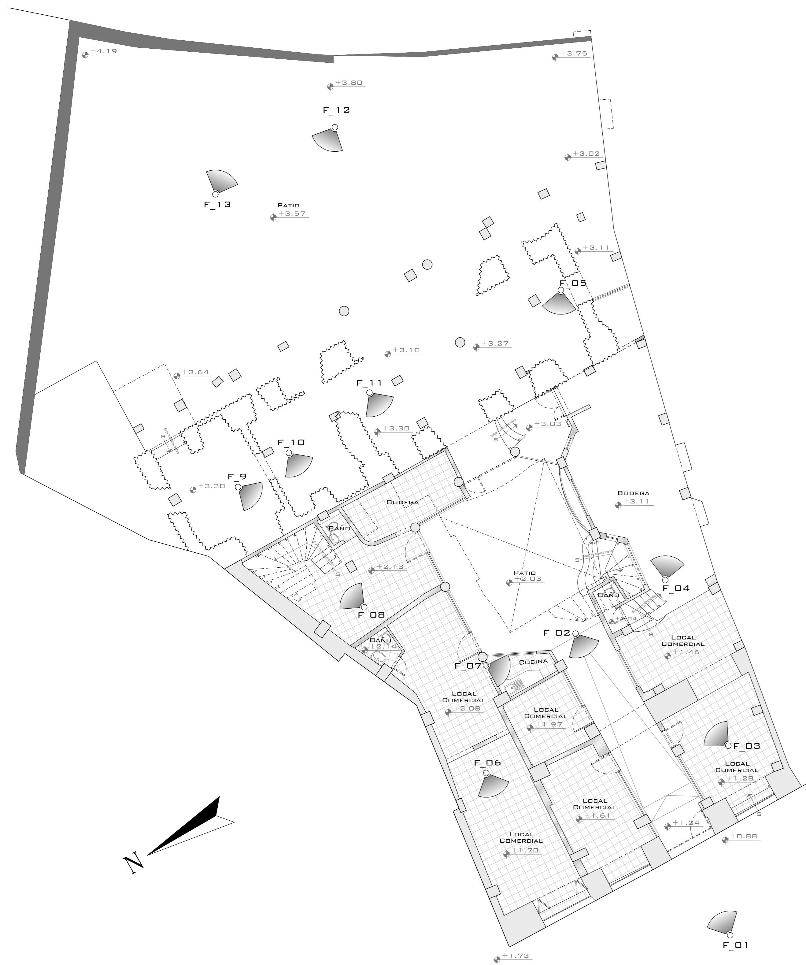
BLOQUE B MEMORIA FOTOGRAFICA NIVEL +2.03/+3.30 ESC: 1 100