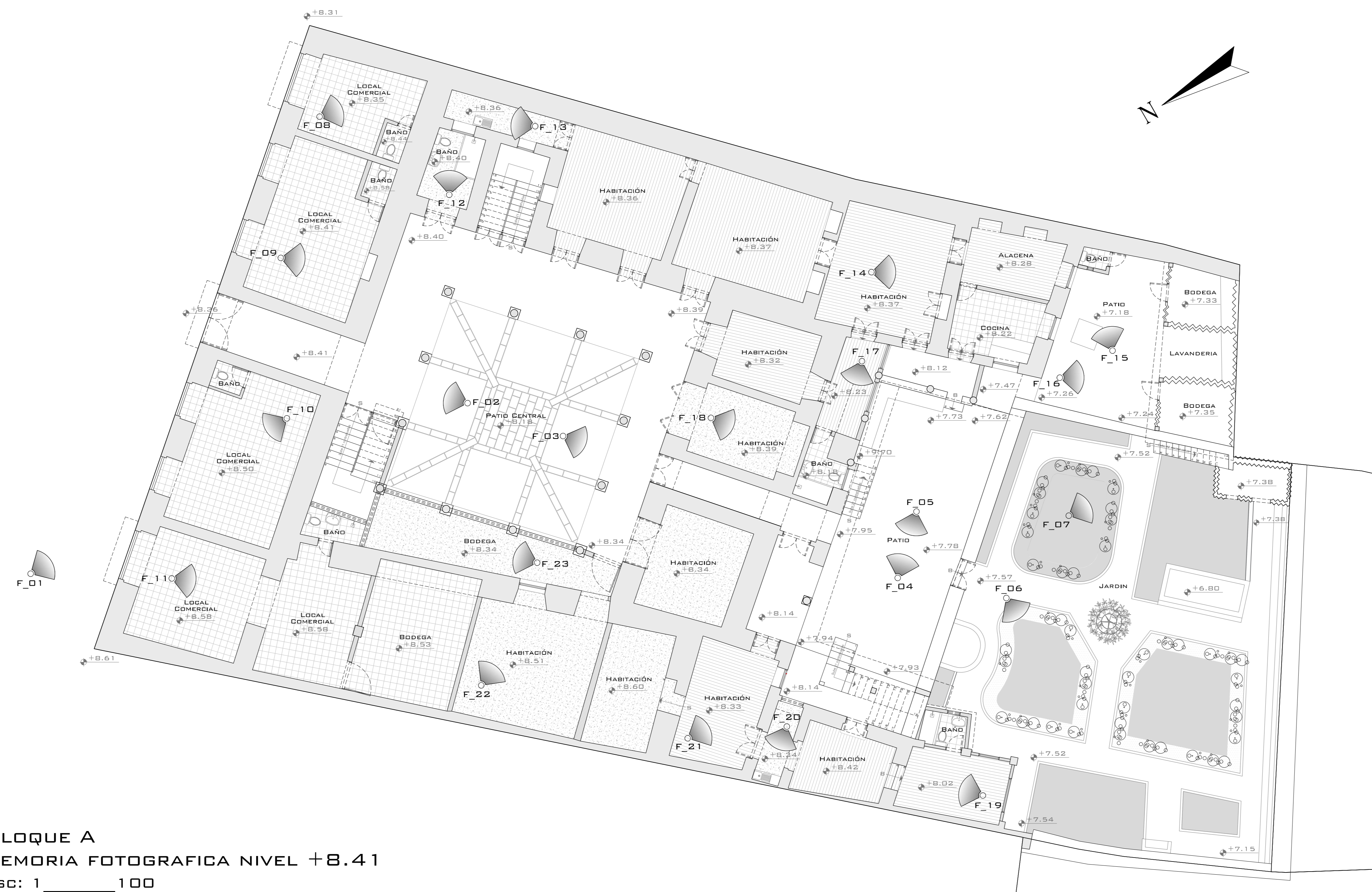
BLOQUE A MEMORIA FOTOGRAFICA NIVEL +8.41 ESC: 1 _____ 100 0 1 2 3 4 5 6