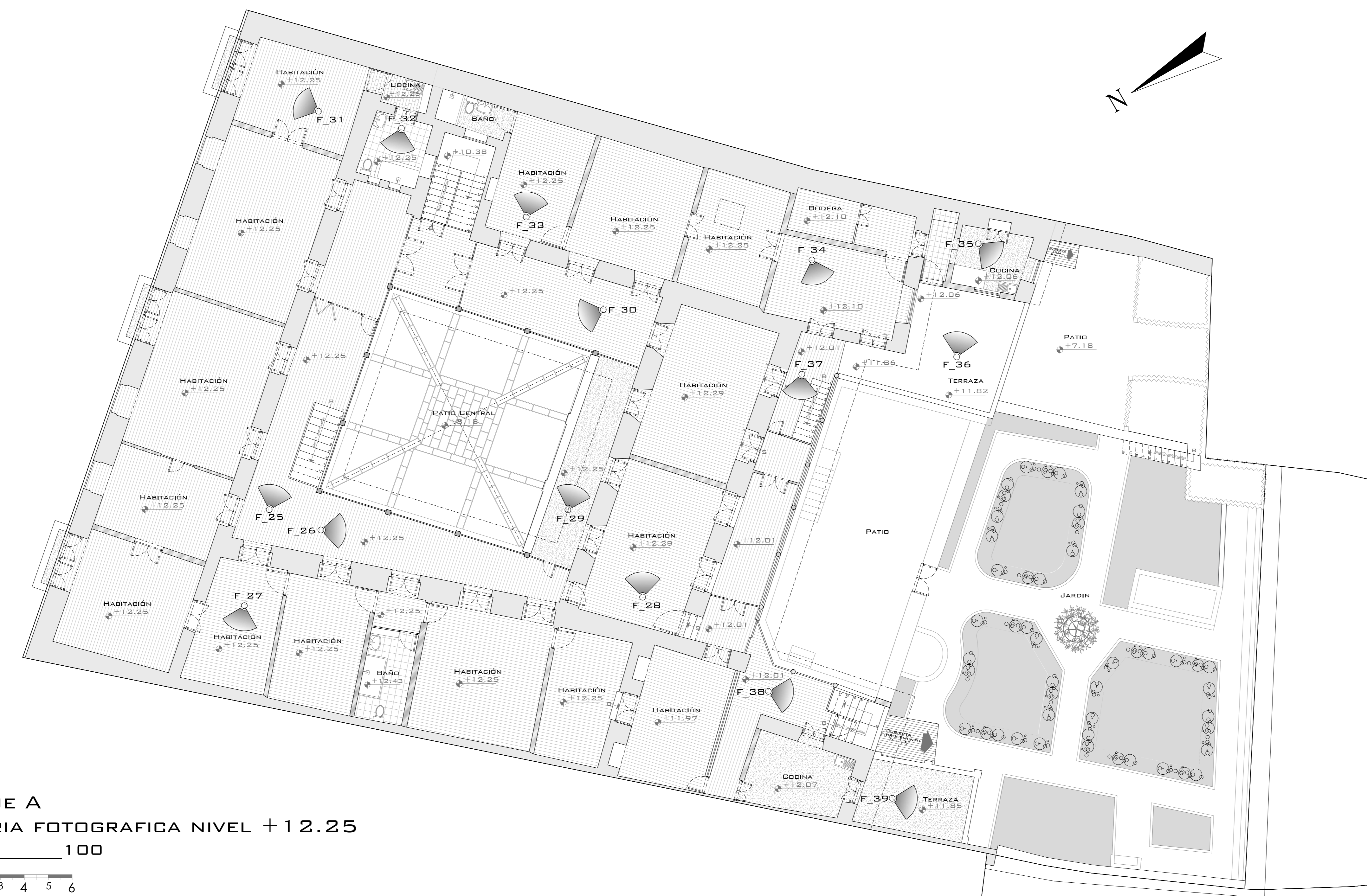
BLOQUE A MEMORIA FOTOGRAFICA NIVEL +12.25 ESC: 1 _____ 100 0 1 2 3 4 5 6