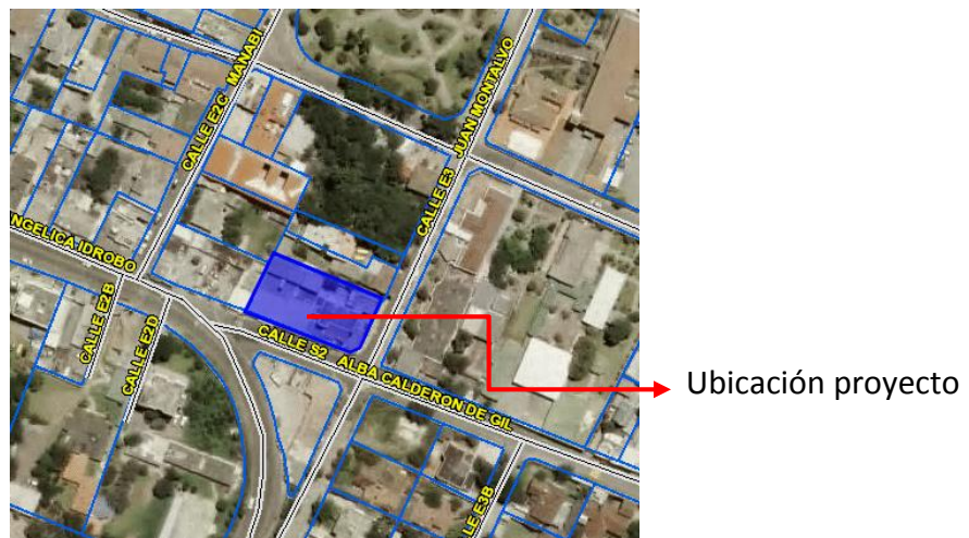
Imagen 1. Forma de manzana.

La implantación del proyecto se encuentra en un lote de terreno esquinero, emplazado en las calles Alba Calderón de Gil y Juan Montalvo, cuya morfología de su entorno está compuesto, por lotes de forma regular, adaptados a la topografía del lugar, como se muestra a continuación: