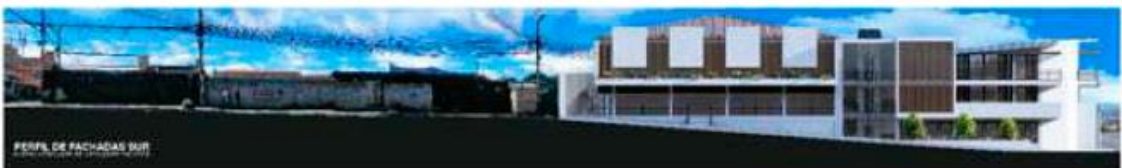
Imagen 2: Inserción de la fachada al contexto