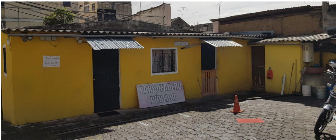
CONSTRUCCIÓN DEL PREDIO 34404