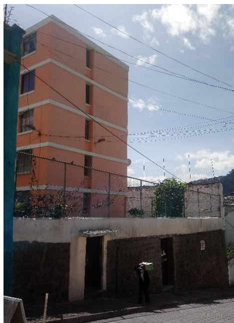
CALLE BENIGNO VELA, CONDOMINIO FRENTE AL LOTE 34404

En el otro lado de la calle Benigno Vela, al frente del Predio 34404, se encuentra un condominio con una altura de 5 pisos; construido con estructura de hormigón armado; el frente del lote, hacia la calle Vela, está ocupado por el cerramiento, de piedra en su parte baja y de malla galvanizada en la parte alta. La fachada del condominio que da a esta calle presenta pequeñas ventanas rectangulares en su centro, una por cada piso. La cubierta es una losa plana de hormigón armado.