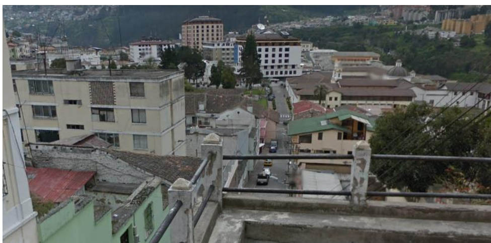
ESCALINATA, BENIGNO VELA; CONSTRUCCIONES DE HORMIGÓN

Los entrepisos son soportados por vigas de madera, dando lugar a la existencia de tumbados o cielos falsos. Las cubiertas presentan una estructura con cerchas, definiendo así cubiertas de estilo tradicional ya descritas.