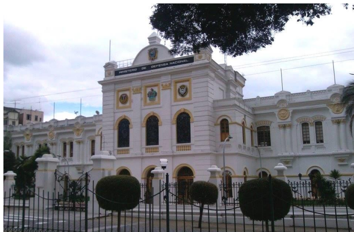
MINISTERIO DE DEFENSA NACIONAL

A una cuadra se encuentra el Palacio de La Recoleta, sede del Ministerio de Defensa Nacional, fue mandado a construir en 1908, por el entonces presidente de la República, el Gral. Eloy Alfaro. Su arquitectura fue concebida siguiendo el estilo neoclásico, basado en modelos introducidos en Ecuador por el arquitecto italiano Giacomo Radiconcini, a principios del siglo XX.