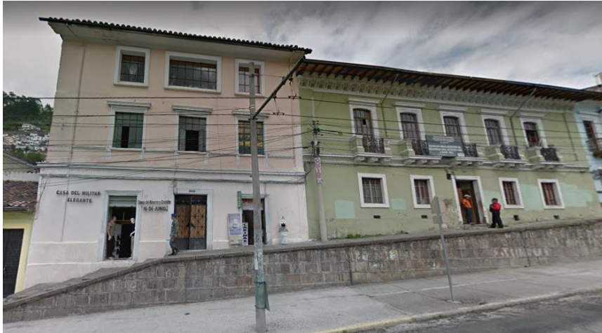
CONSTRUCCIONES SOBRE LA AV. MALDONADO Y BENIGNO VELA

pronunciadas han tenido que iniciar sobre muros para conseguir uniformizar su diseño.