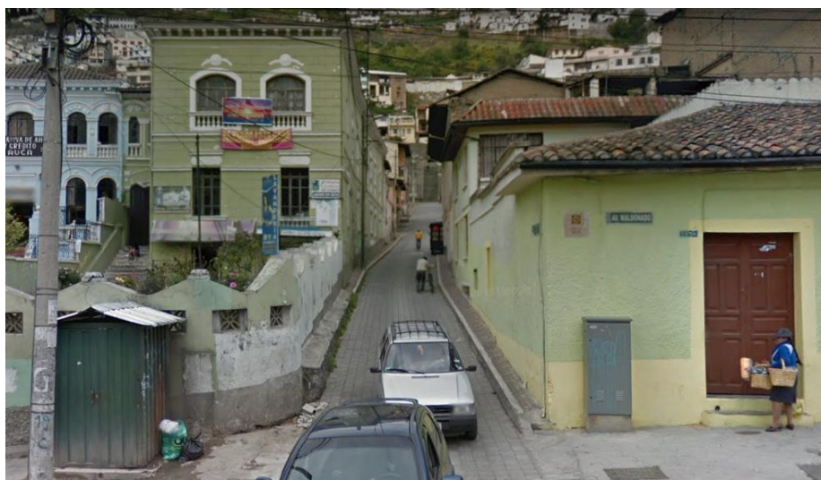
CALLE BENIGNO VELA, VISTA FRONTAL

La disposición de las ventanas, en planta baja como en los pisos superiores es hacia la calle y donde ha sido posible hacia los costados de las construcciones, (donde el retiro les ha favorecido); creando así fachadas frontales sin superposición de volúmenes ni paredes, solo mostrando vanos de puertas y ventanas, definidos por molduras en alfeizares y dinteles, todos estos en una marcada disposición rectangular con orientación en vertical.