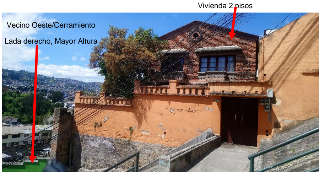
CALLE BENIGNO VELA, ESCALINATA LADO SUR

Continuando por la escalina (en el mismo lado de las viviendas anteriores), se encuentra una construcción de 2 pisos de altura, con su fachada de ladrillo visto, una cubierta a dos aguas recubierta de teja. Todo el frente del lote lo ocupa el cerramiento con la puerta de ingreso peatonal en la parte derecha.