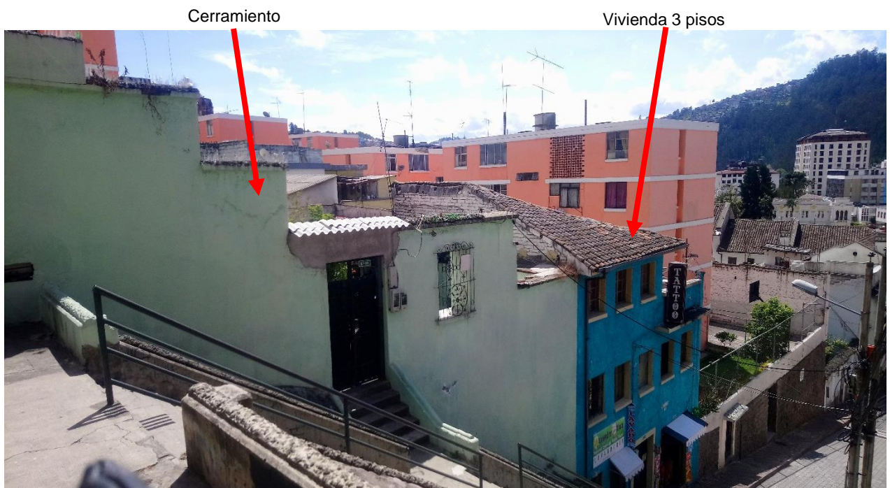
ESCALINATA, BENIGNO VELA

Avanzando por la escalinata se identifican: una vivienda de 3 pisos de altura, con una cubierta inclinada recubierta de tejas, con una fachada regular en la que se han distribuido de manera simétrica los vanos cuadrados de las ventanas en los pisos superiores, en planta baja se aprecian una puerta y dos ventanas. Junto a la construcción ya descrita se observa un cerramiento de gran altura en el que destacan solamente la puerta de ingreso peatonal y un vano cuadrado (ventana).