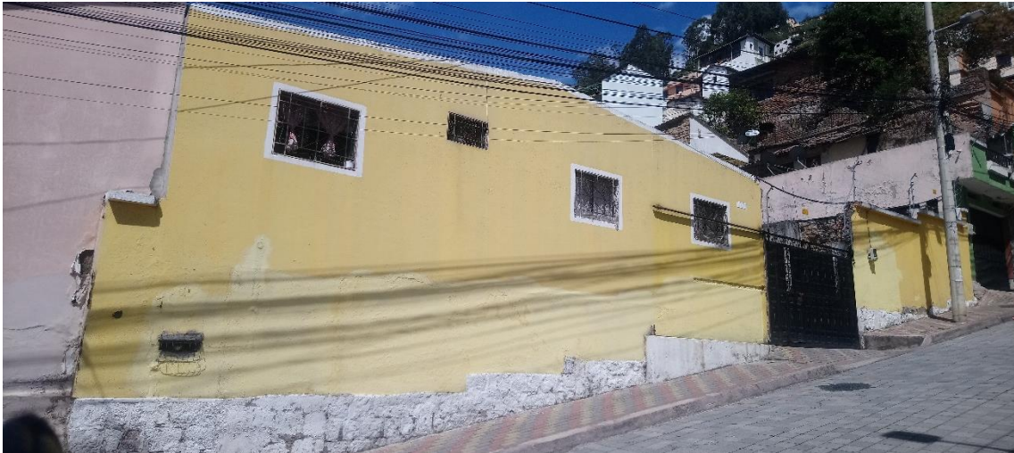
FRENTE DEL PREDIO 34404

La Construcción en el Predio 34404 Propiedad del Sr. Edmundo Vaca, no presenta un sistema constructivo de muros portantes, ni tampoco una cubierta tradicional revestida con tejas. Su fachada no ocupa todo el frente del lote, y solamente presenta los vanos de las ventanas a la altura de 1 piso. Su frente de lote también lo conforman la puerta de ingreso vehicular y peatonal junto con el muro del cerramiento a la derecha.