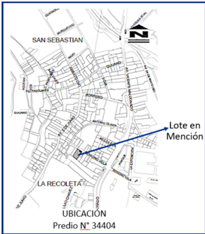
CROQUIS - UBICACIÓN

A una cuadra se encuentra el Palacio de La Recoleta, sede del Ministerio de Defensa Nacional, fue mandado a construir en 1908, por el entonces presidente de la República, el Gral. Eloy Alfaro. Su arquitectura fue concebida siguiendo el estilo neoclásico, basado en modelos introducidos en Ecuador por el arquitecto italiano Giacomo Radiconcini, a principios del siglo XX.