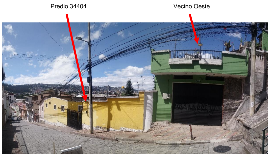
CALLE BENIGNO VELA, FACHADAS

Como colindante inmediato hacia el oeste, se encuentra una construcción de un piso de altura, de la cual hacia la fachada frontal solo se aprecia la puerta de ingreso vehicular y el muro del cerramiento que sigue aumentando de altura conforme aumenta la pendiente de las escalinatas que empiezan a 1 metro de distancia de la puerta mencionada y concluyen en su parte superior en la calle Antonio Tejada.