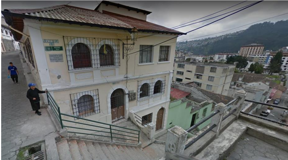
ESCALINATA CALLE ANTONIO TEJADA

Las construcciones vecinas ubicadas en la calle Benigno Vela, y Antonio Tejada, son usadas como residencias y locales comerciales en planta baja. La mayoría de estas han tenido intervenciones, arreglos realizados por sus propietarios. De su arquitectura original se conservan las cubiertas inclinadas y la forma de ocupación del predio.