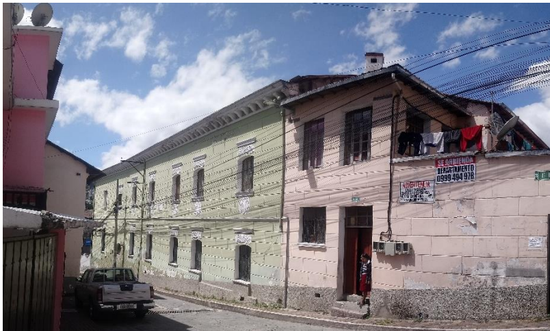
CALLE BENIGNO VELA, Y AV. PEDRO VICENTE MALDONADO

El uso principal de las construcciones del sector es residencial, el comercio se hace visible en las plantas bajas sobre la Avenida Maldonado principalmente.