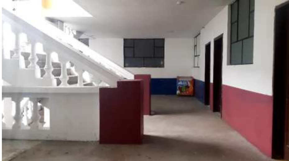
F10. Imagen de gradas Niv. + 3.26, se encuentra en buen estado, se observa que el piso no tiene ningún tipo de revestimiento.