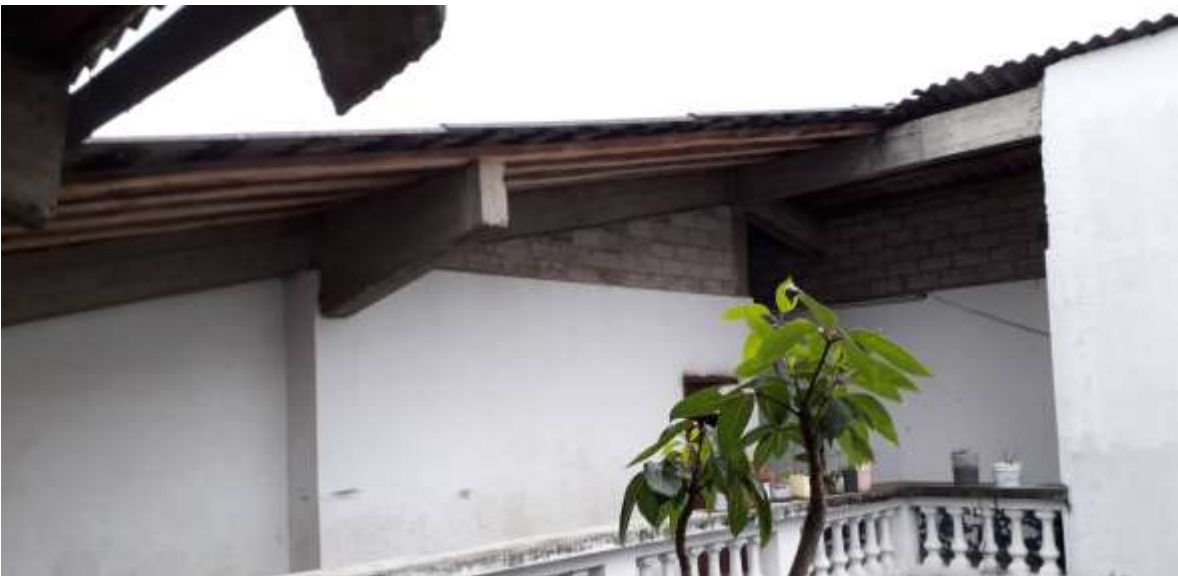
F18. Imagen de cubierta, se observa que las vigas principales son de hormigón armado y se encuentran en perfectas condiciones.