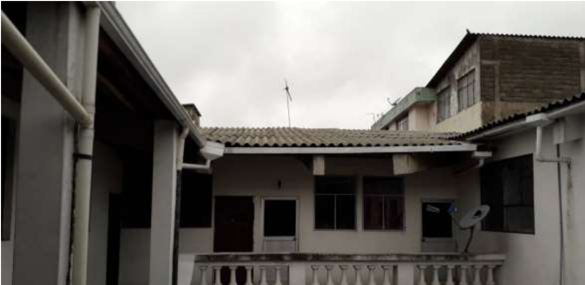
F17. Imagen pozo de luz # 1 se observa que existe un desgaste de la pintura por falta de mantenimiento.