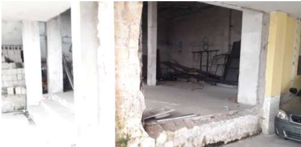
F8. Imagen de bodega en planta baja, la cual tiene una pared derrocada, además se puede apreciar que la estructura de la edificación se encuentra en buen estado.