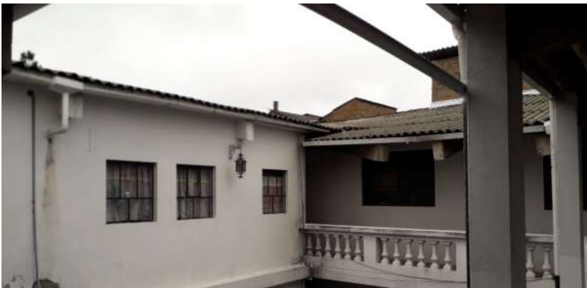
F16. Imagen pozo de luz # 2, se observa que existe un desgaste de la pintura por falta de mantenimiento.