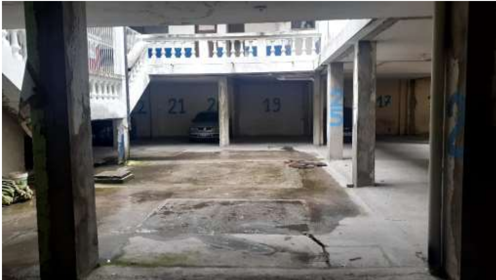
F5. Imagen de pozo de luz # 1, se aprecia el buen estado de su estructura (columnas de hormigón armado), pero existe deterioro de pintura por falta de mantenimiento.