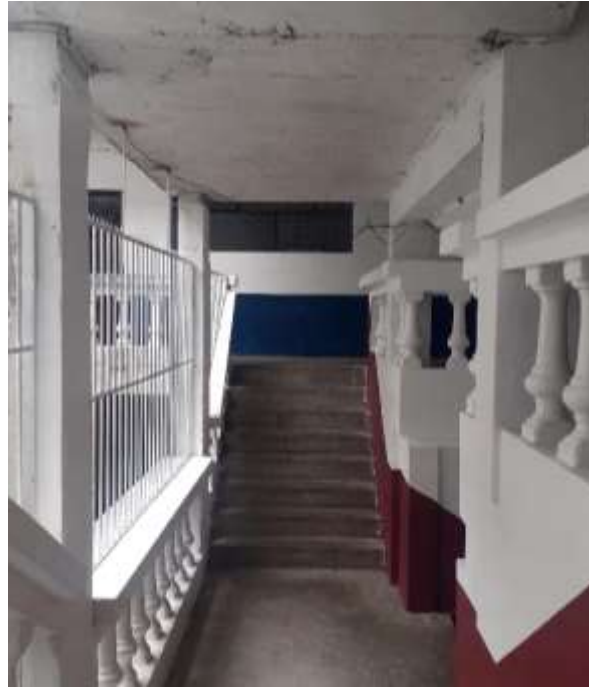
F9. Imagen de acceso al Niv. + 3.26, en donde se puede apreciar que se encuentran en buen estado.