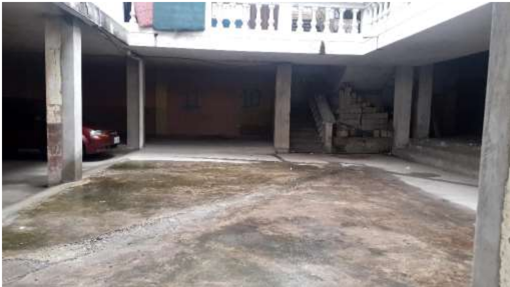
F6. Imagen de pozo de luz # 2, se aprecia el buen estado de su estructura (columnas de hormigón armado), pero existe deterioro de pintura por falta de mantenimiento y desgaste del masillado del piso.