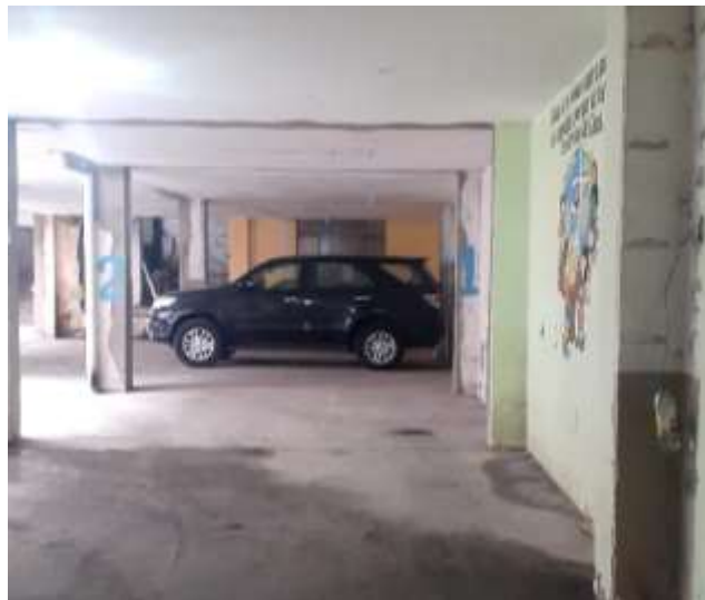
F4. Imagen de acceso vehicular, deterioro de pintura por falta de mantenimiento.