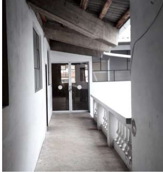
F19. Imagen pasillo patio # 1, se observa en buen estado