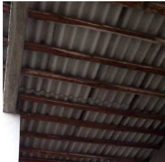
F20. Imagen de cubierta, se observan que los elementos estructurales se encuentran en buen estado.

EL PRESENTE INFORME HA SIDO REALIZADO, POR EL ARQUITECTO Hector Geovanny Sinchiguano G.