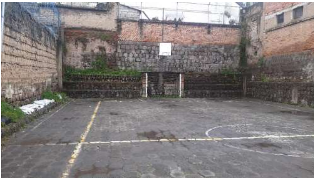
F14. Imagen de patio posterior, el patio tiene un recubrimiento de adoquín, a la izquierda se observa un muro de adobe, al frente y el lado derecho se observan muros de piedra y ladrillo.