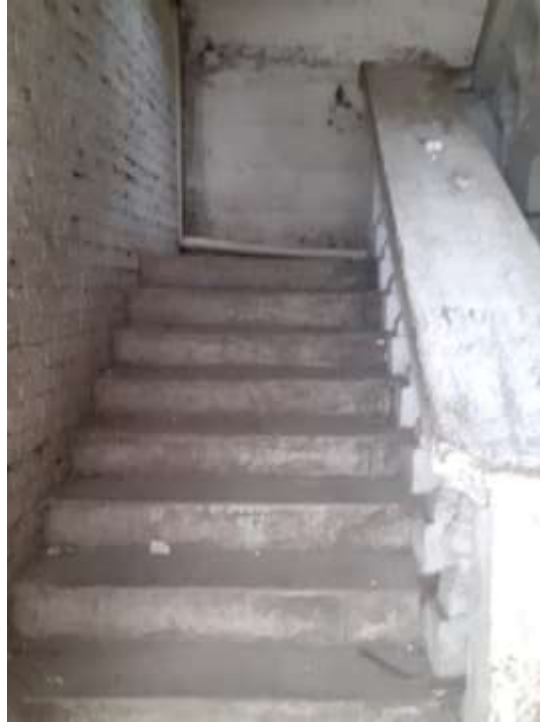
F7. Imagen de gradas posterior, las cuales se encuentran en buen estado, únicamente hay que darles mantenimiento.