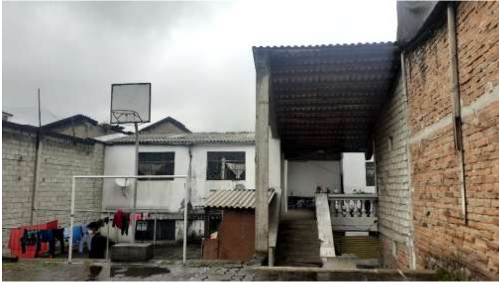
F13. Imagen de patio posterior, el patio tiene un recubrimiento de adoquín, se cubre cierta parte de la grada y existe un deterioro de pintura.