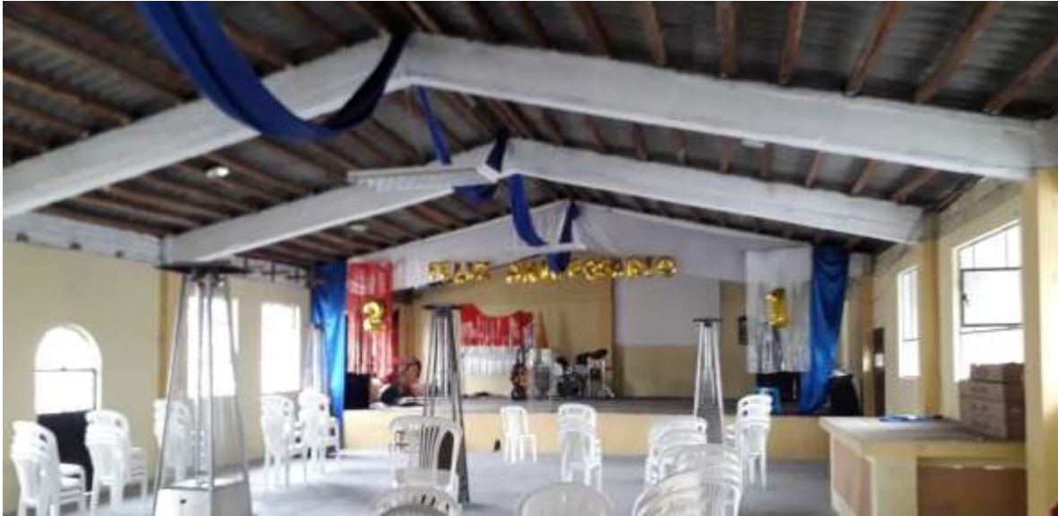
F15. Imagen salón de copropietarios, se encuentra en buen estado, tiene vigas de hormigón armado, existen un entramado de madera y la cubierta es de eternit.