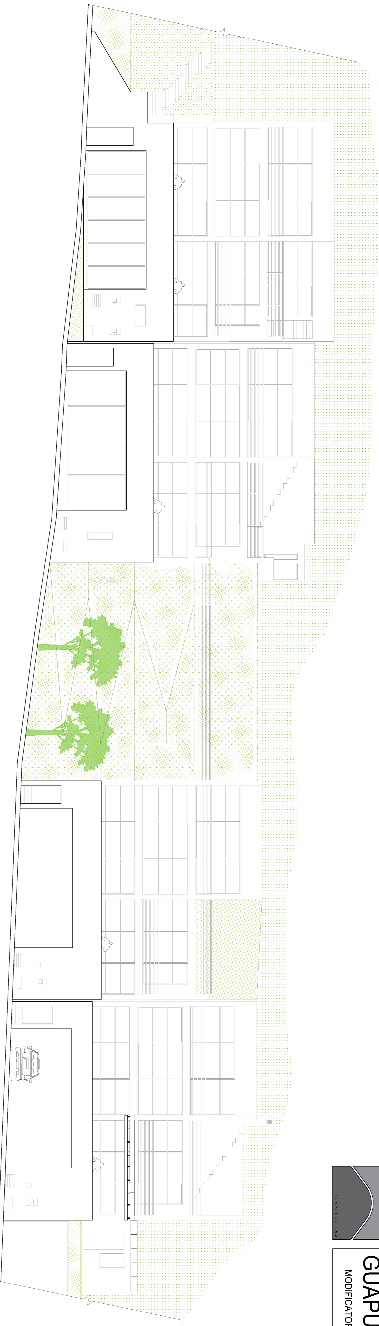
FACHADA ESTE DE CONJUNTO CASAS 1,2,3 y 4 Esc. 1:100