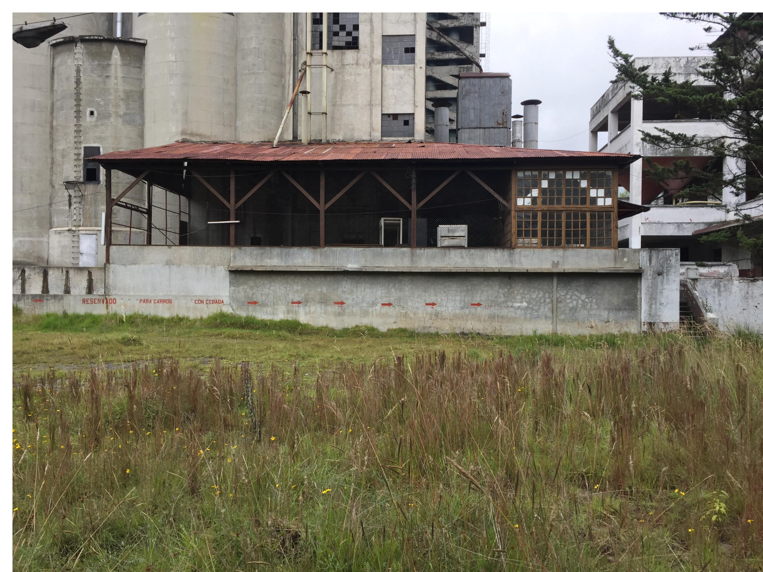
Vista hacia casa de maquinas.