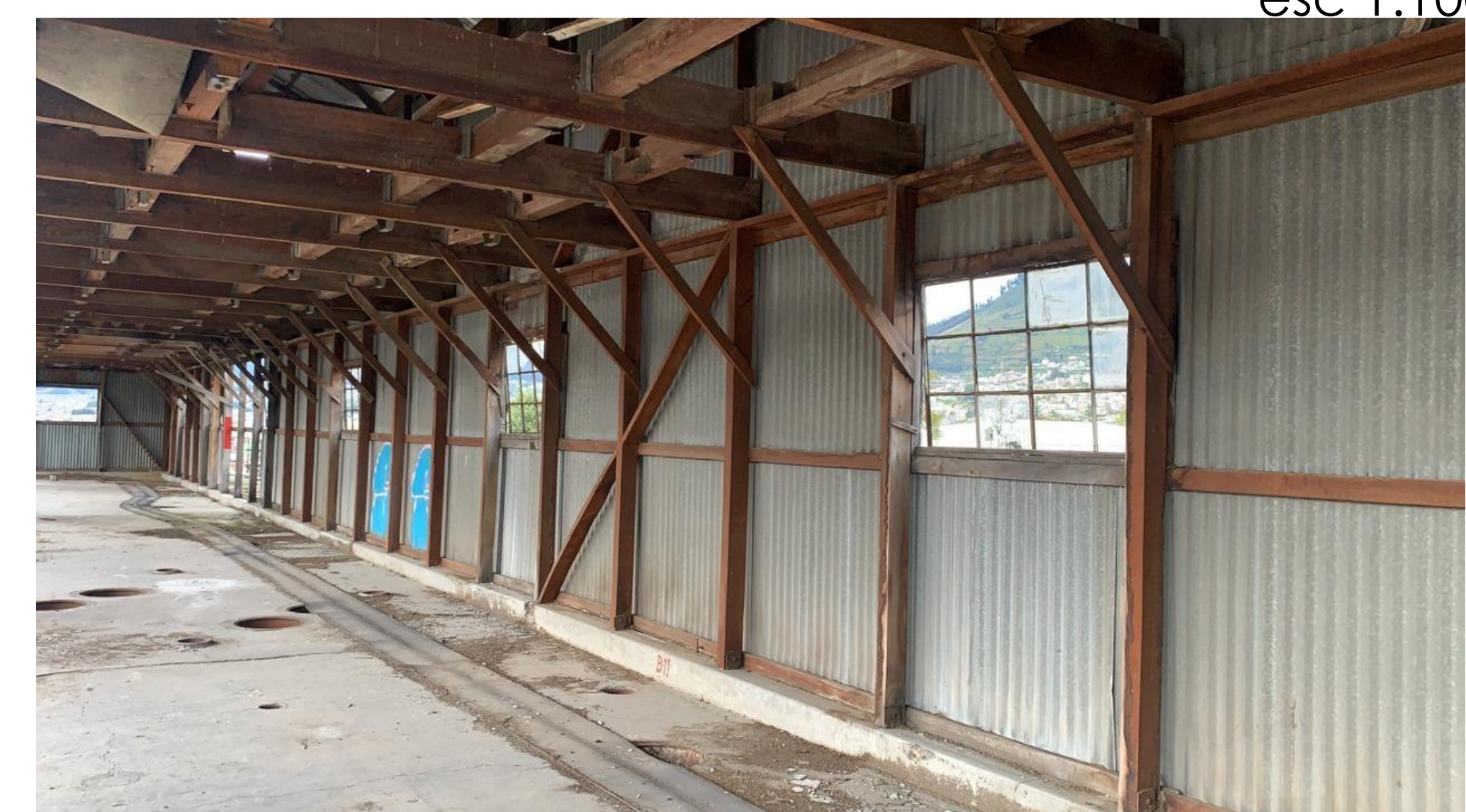
Silos nivel +25.26, paredes revestidas con plancha de zinc