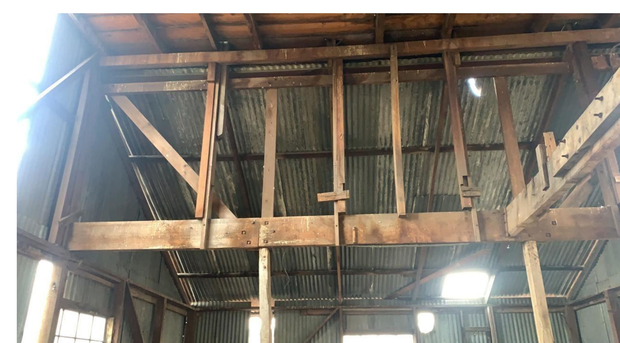
Silos nivel +25.26, estructuras deteriorada.