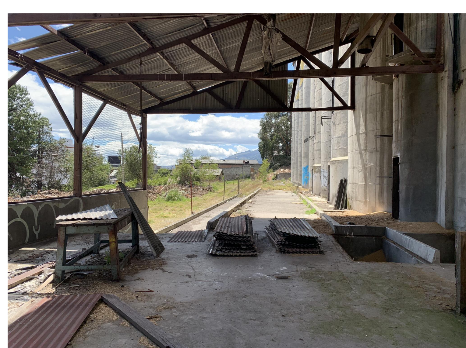
Vista interior casa de maquinas, cubierta con planchas de zinc.