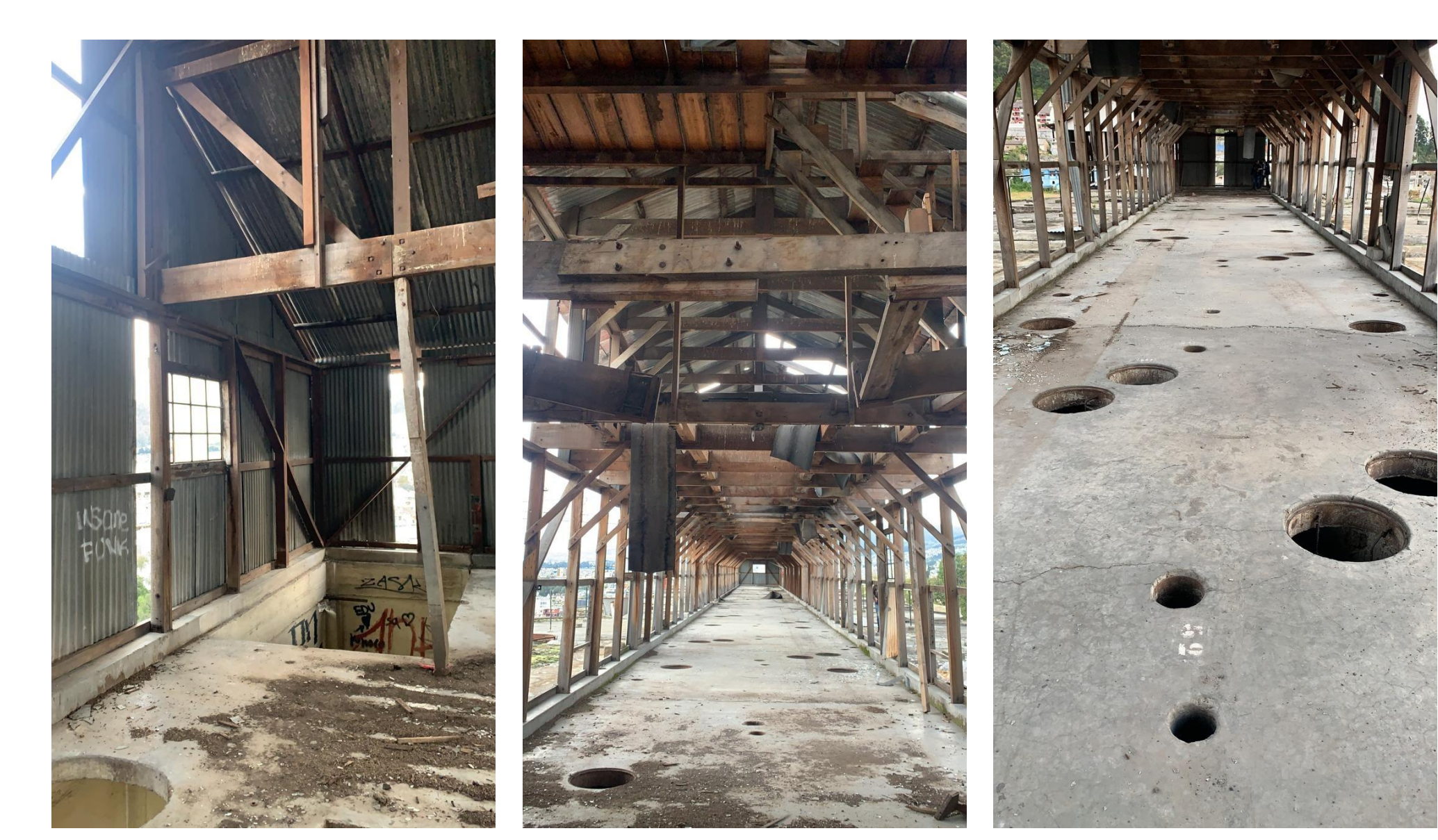
1 2 3