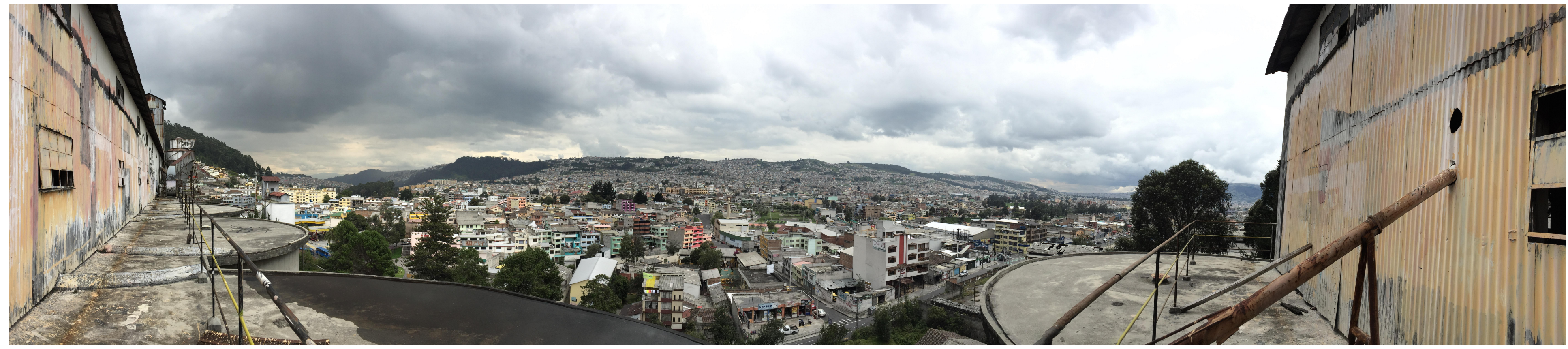
Vista desde la parte alta de los Silos hacia el sur de la ciudad de Quito.