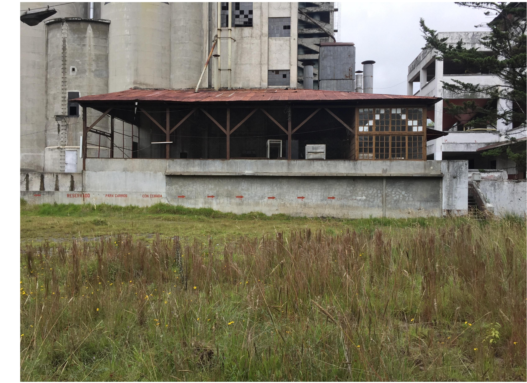
Vista desde el exterior de la casa de maquinas.