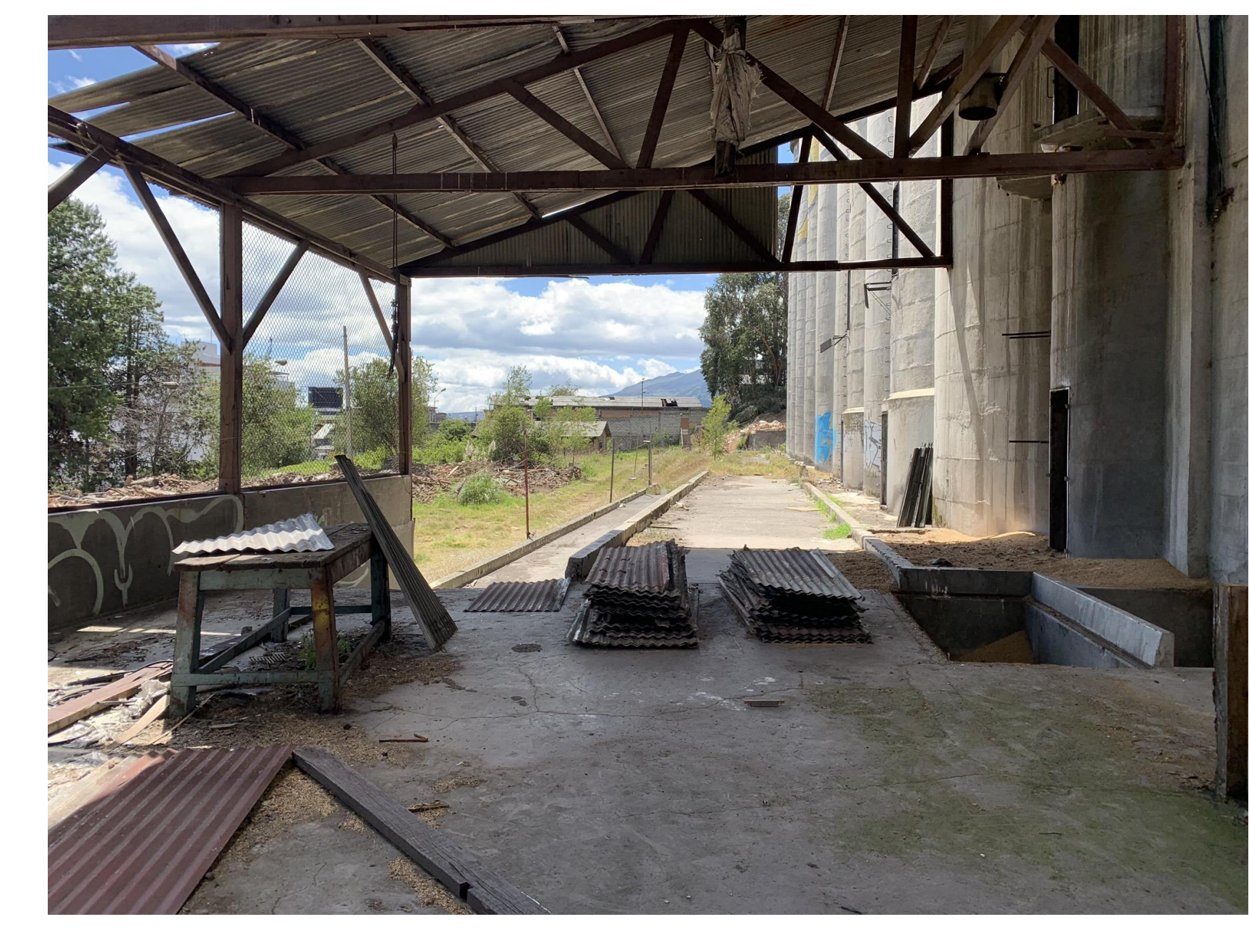
Vista desde el interior de la casa de maquinas.