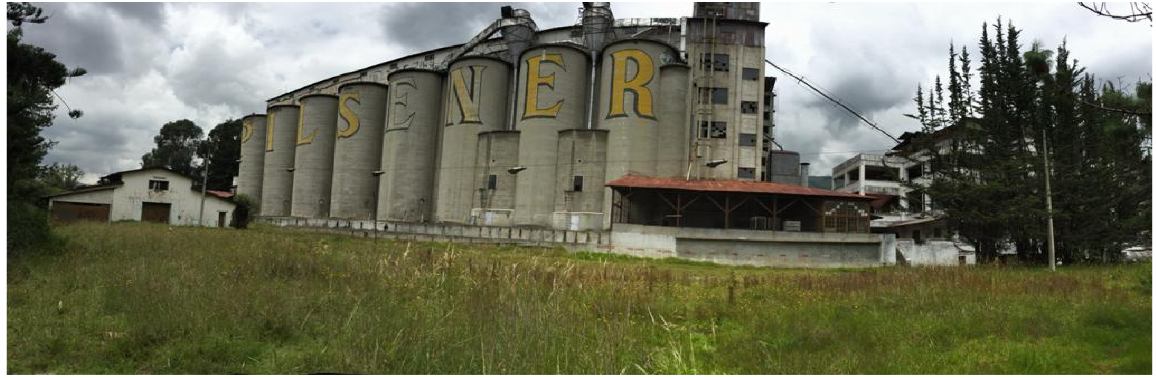
Vista de Silos, desde la Av. 5 de junio.