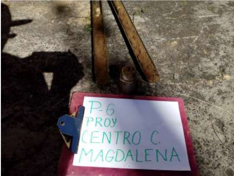
SONDEO P-6, MUESTRA EN TUBO PARTIDO, PROF. 0.50-1.00 m.,