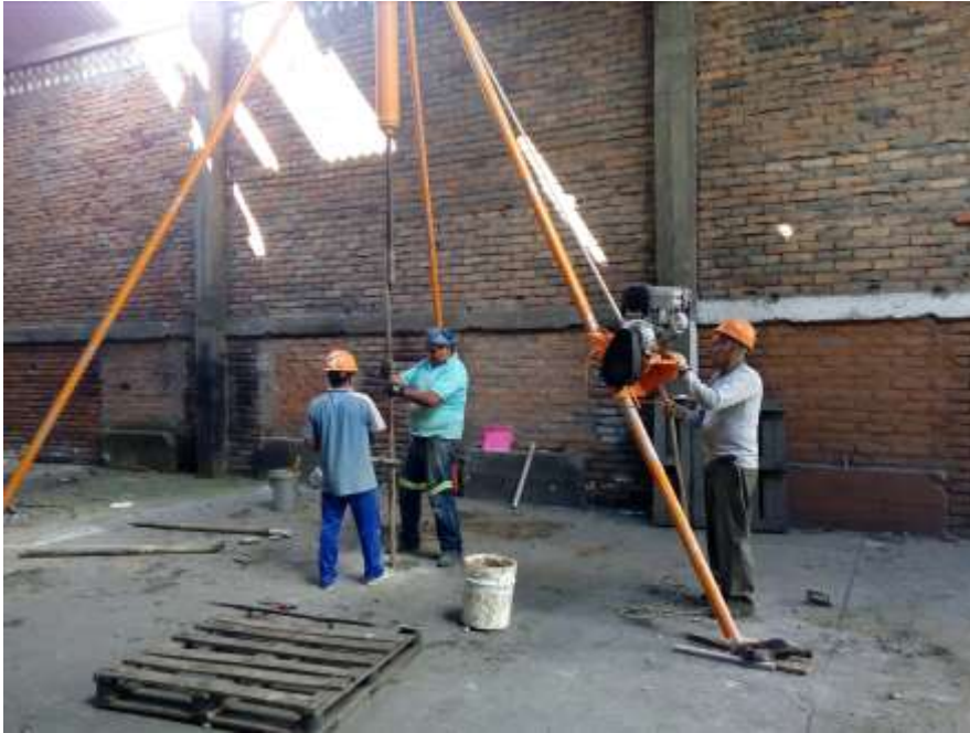
SONDEO P-5, PROCESO DEL ENSAYO DE PENETRACION ESTANDAR SPT.