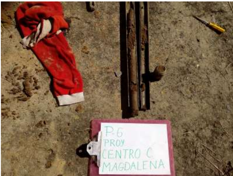
SONDEO P-6, MUESTRA EN TUBO PARTIDO, PROF. 1.00-1.50 m.,