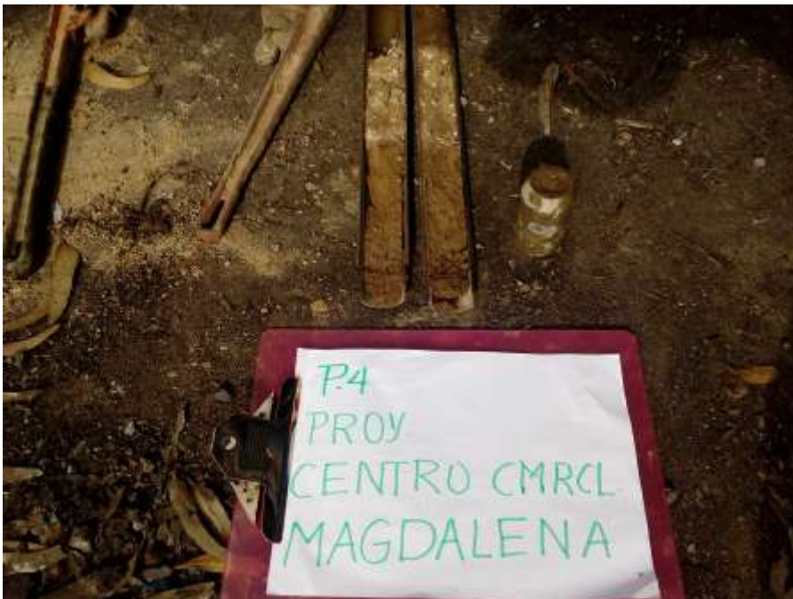
SONDEO P-4, MUESTRA EN TUBO PARTIDO, PROF. 1.00-1.50 m.,