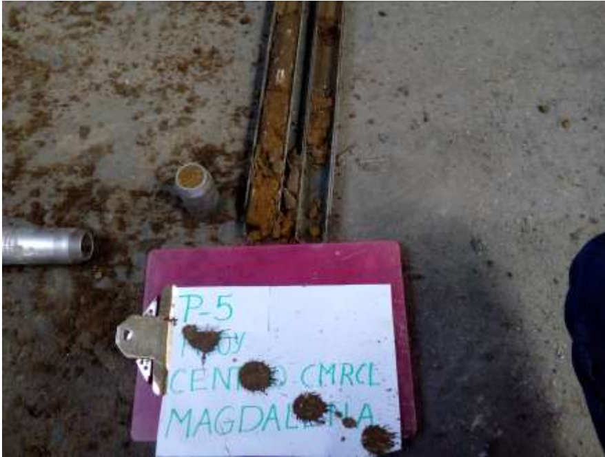
SONDEO P-5, MUESTRA EN TUBO PARTIDO, PROF. 1.00-1.50 m.,