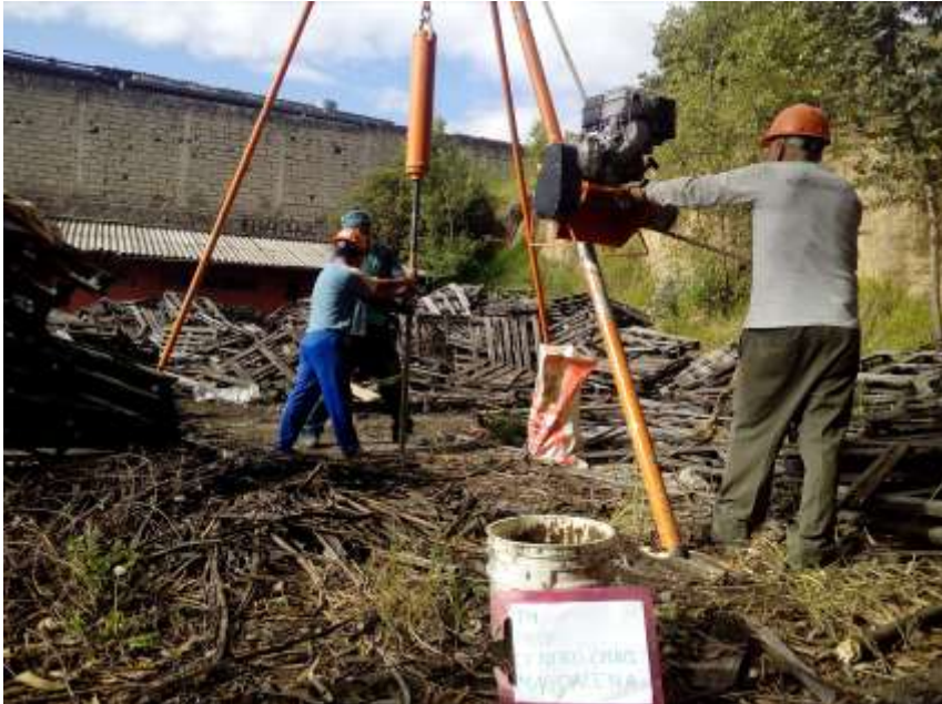
SONDEO P-4, PROCESO DEL ENSAYO DE PENETRACION ESTANDAR SPT.