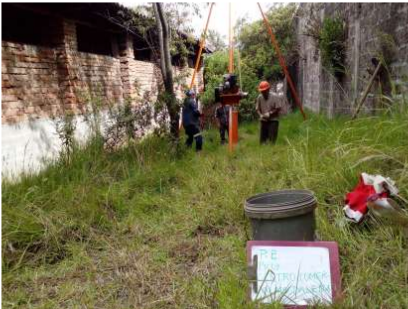
SONDEO P-2, PROCESO DEL ENSAYO DE PENETRACION ESTANDAR SPT.