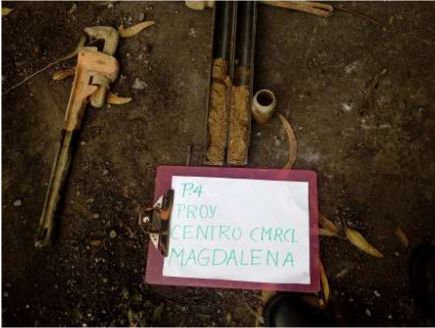
.SONDEO P-4, MUESTRA EN TUBO PARTIDO, PROF. 0.50-1.00 m.,