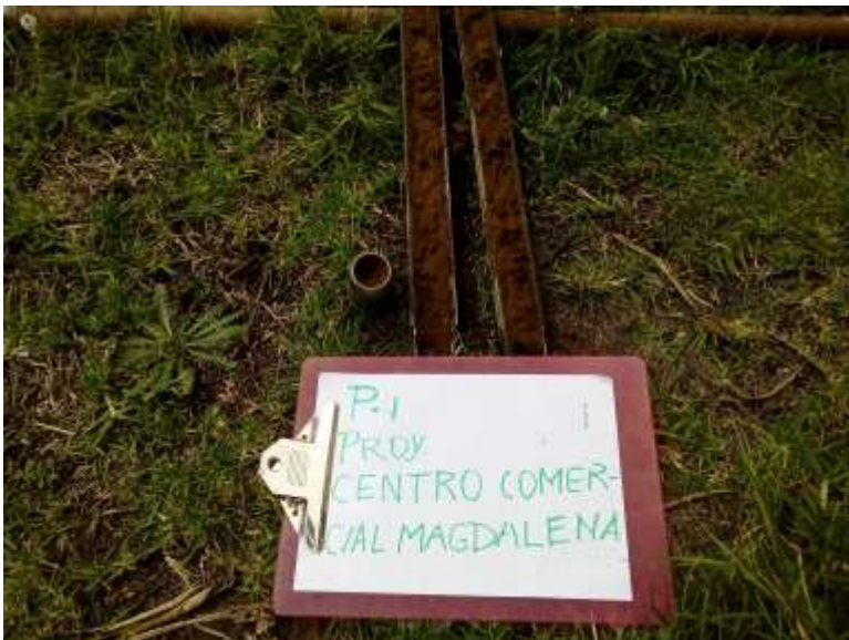
SONDEO P-1, MUESTRA EN TUBO PARTIDO, PROF. 0.50-1.00 m.,