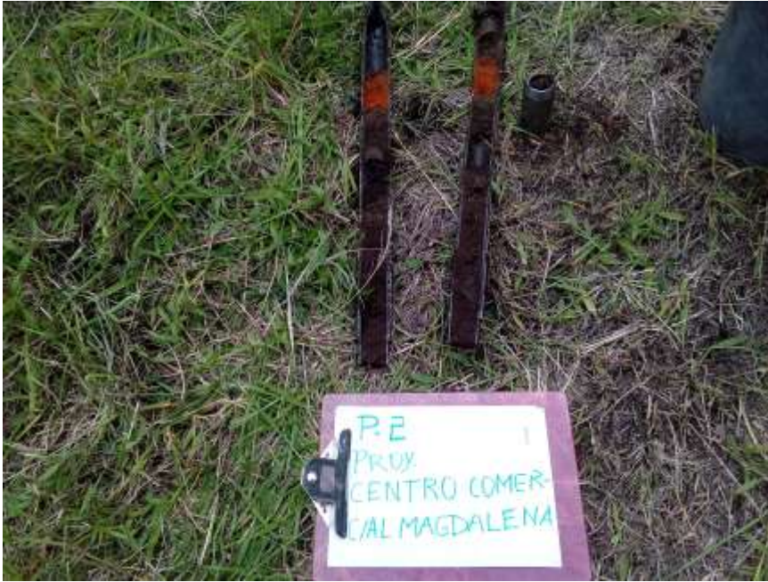
SONDEO P-2, MUESTRA EN TUBO PARTIDO, PROF. 0.50-1.00 m.,