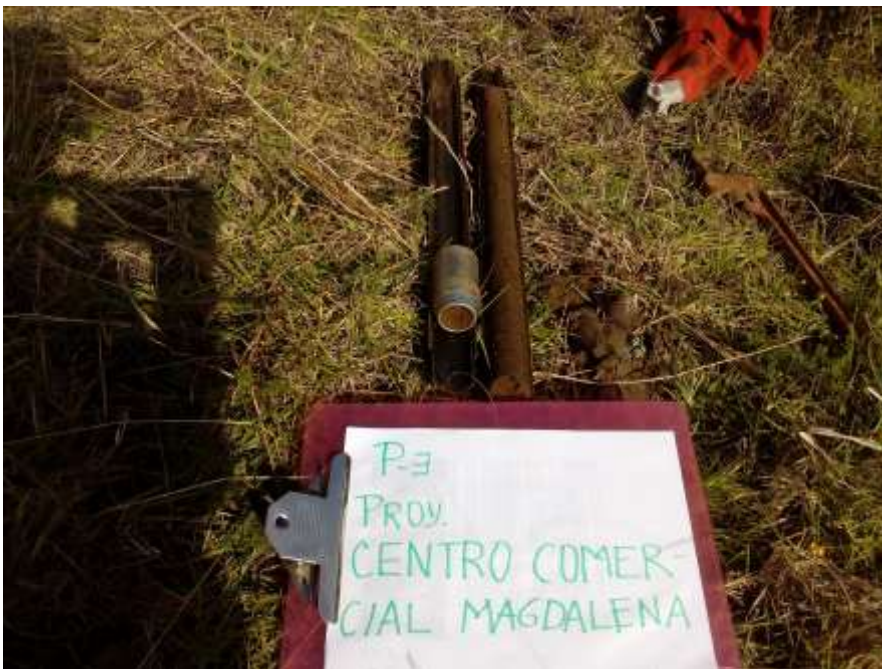
SONDEO P-3, MUESTRA EN TUBO PARTIDO, PROF. 0.50-1.00 m.,