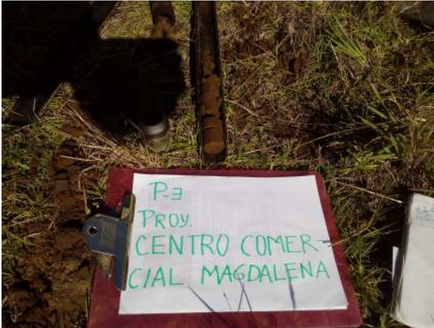
SONDEO P-3, MUESTRA EN TUBO PARTIDO, PROF. 1.00-1.50 m.,