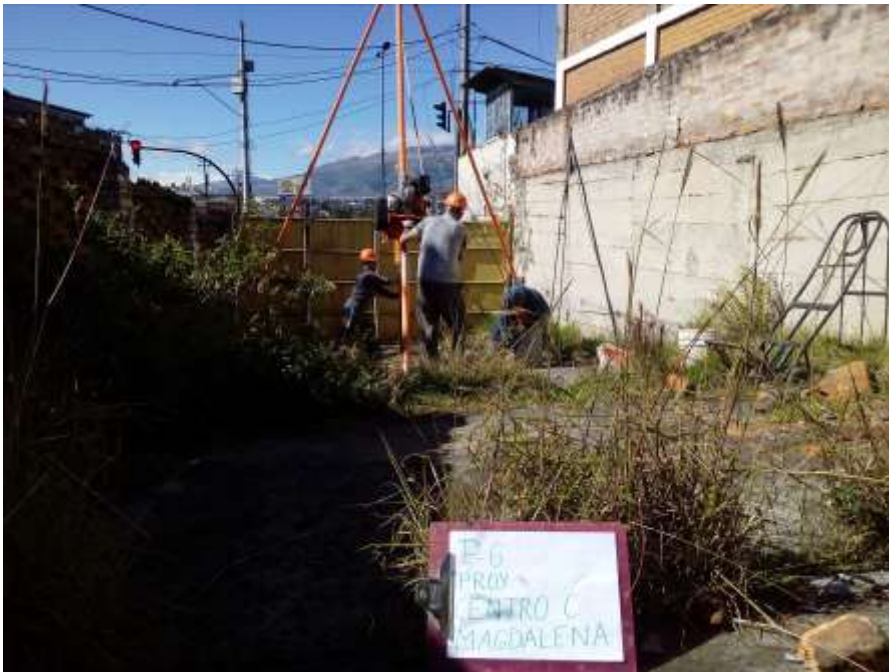
SONDEO P-6, PROCESO DEL ENSAYO DE PENETRACION ESTANDAR SPT.