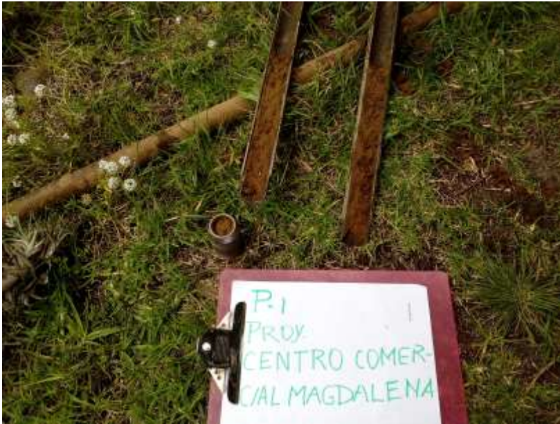
SONDEO P-1, MUESTRA EN TUBO PARTIDO, PROF. 1.00-1.50 m.,