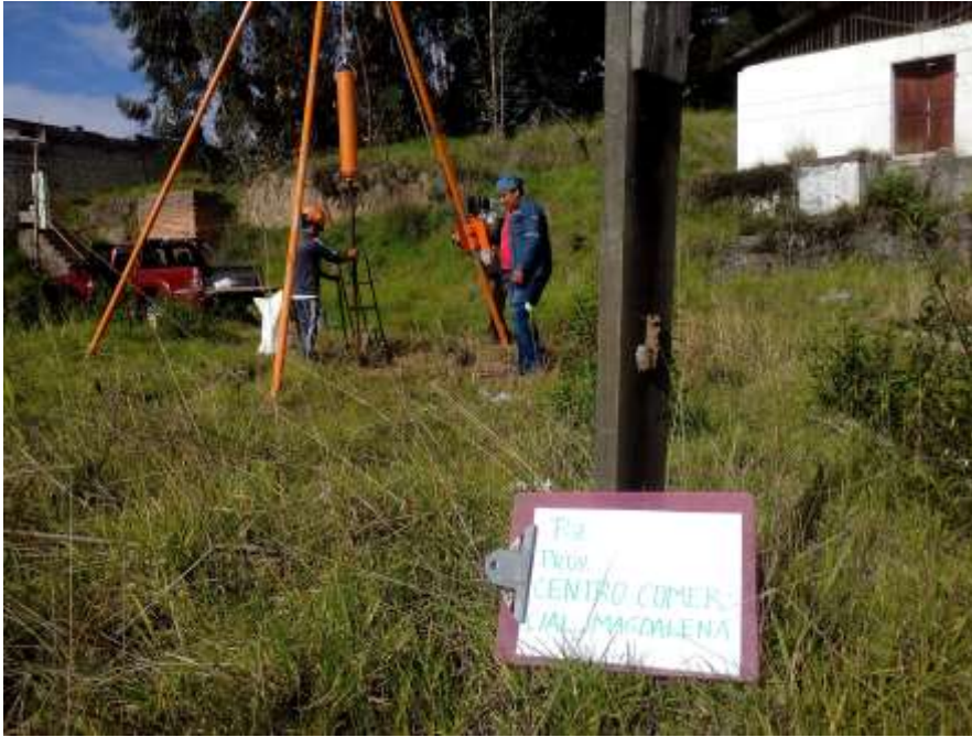
SONDEO P-3, PROCESO DEL ENSAYO DE PENETRACION ESTANDAR SPT.