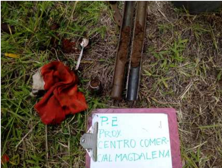
SONDEO P-2, MUESTRA EN TUBO PARTIDO, PROF. 1.00-1.50 m.,