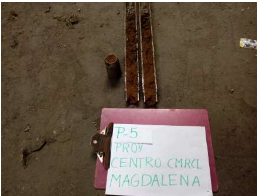
SONDEO P-5, MUESTRA EN TUBO PARTIDO, PROF. 0.50-1.00 m.,