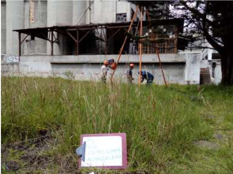
SONDEO P-1, PROCESO DEL ENSAYO DE PENETRACION ESTANDAR SPT.