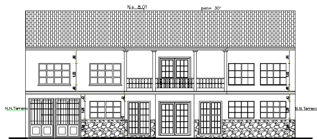
FACHADA FRONTAL PROPUESTA