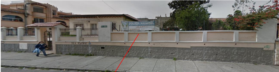
CONSTRUCCIÓN A SER SUSTITUIDA

La propuesta ingresada corresponde a un proyecto definitivo de obra nueva denominado “Edificio Albán Barrera.”, mismo que está ubicado en la parroquia de Conocoto, Se propone sustituir la construcción existente por otra que se implantará tomando en cuenta aspectos con relación al lugar, y a las construcciones dominantes.