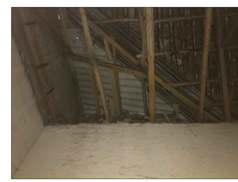
1 Planta alta, losa de hormigón y piso cerámico añadido.