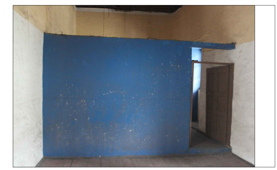
8 Muro bajo