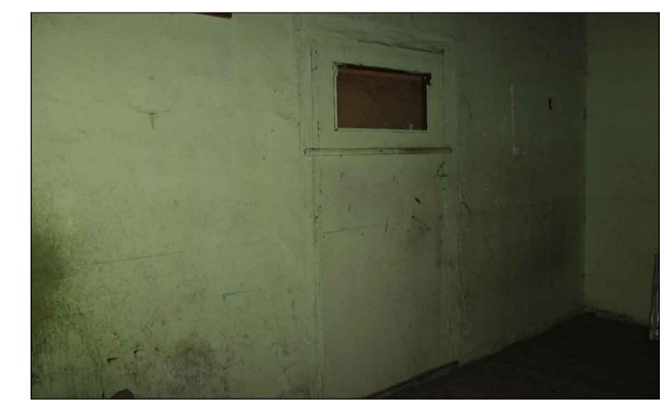
13 Habitación en planta alta, puerta añadida.