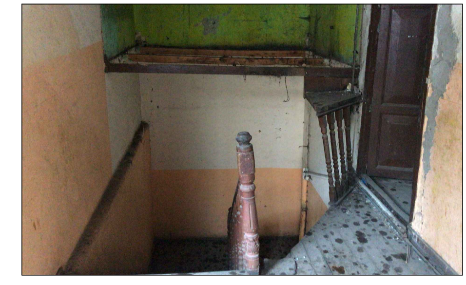
10 Acceso a habitación, corte en piso original