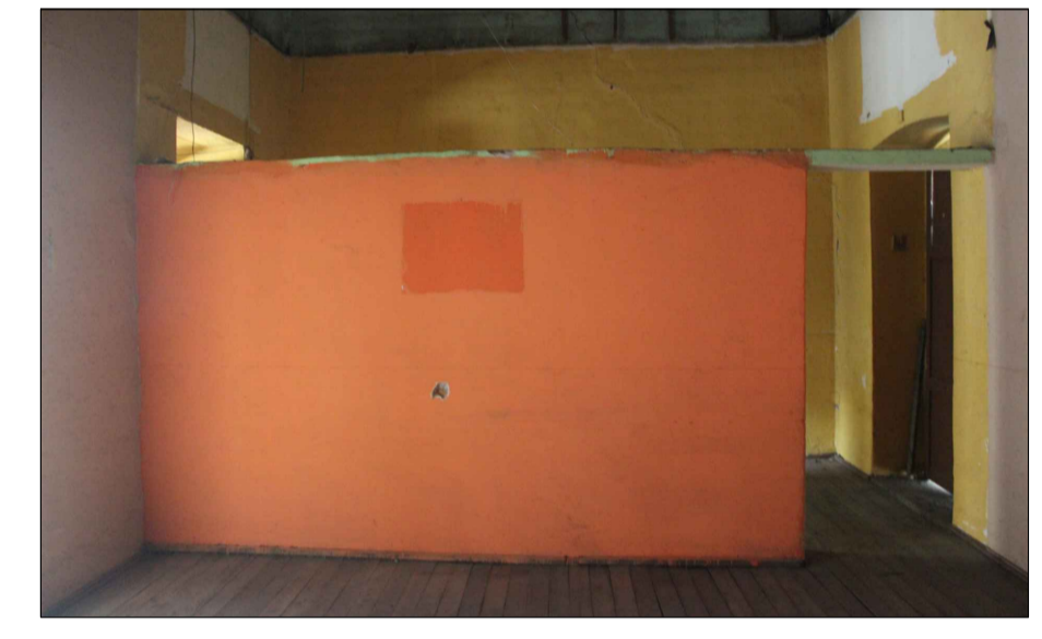
9 Planta alta, pared añadida de bloque. H: