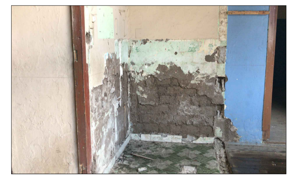
11 12 Planta alta, losa de hormigón y piso cerámico añadido en torno al patio central intervención de sustitución sobre la madera.