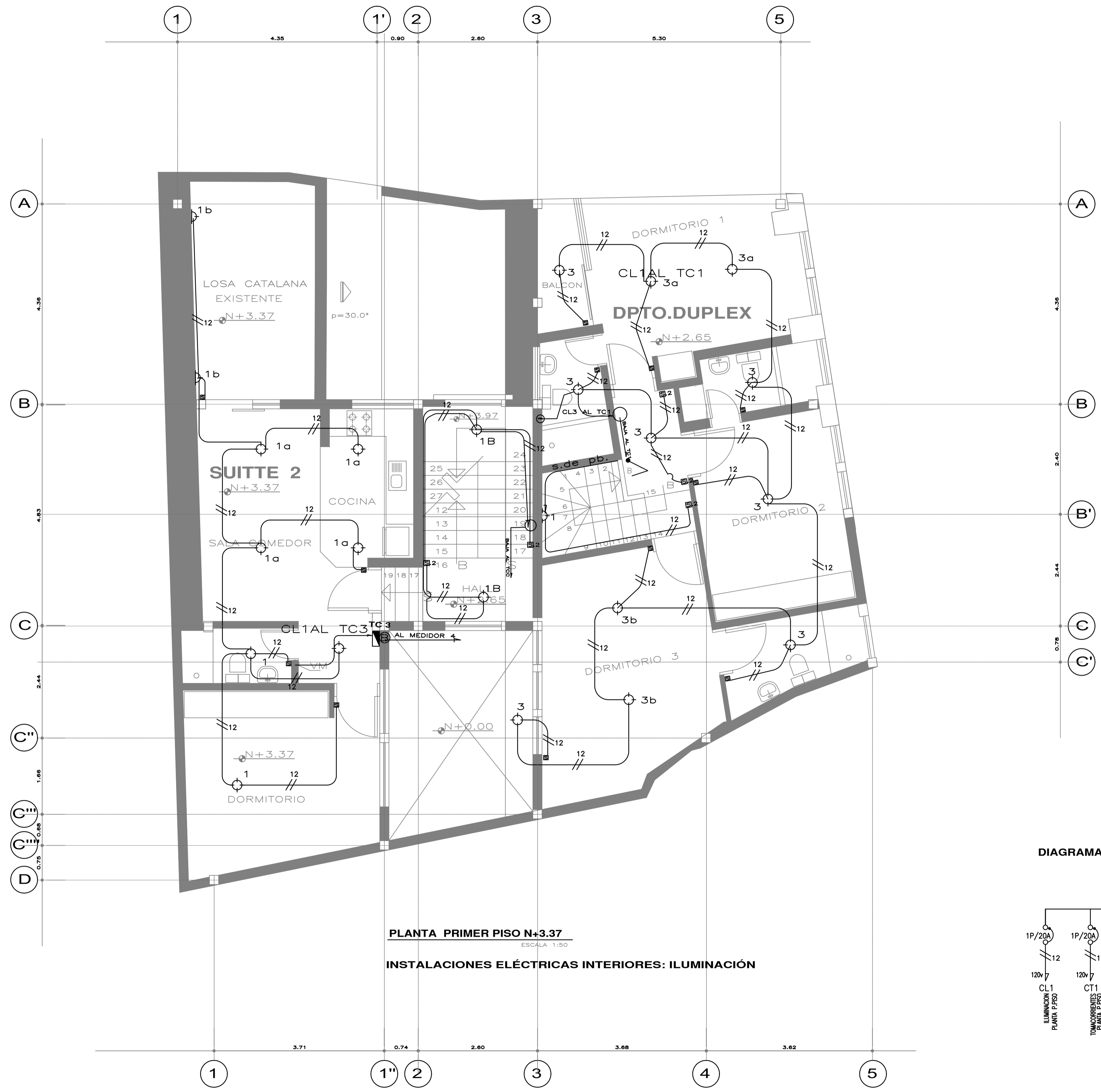
PLANTA PRIMER PISO N+3.37 ESCALA 1:50 INSTALACIONES ELÉCTRICAS INTERIORES: ILUMINACIÓN