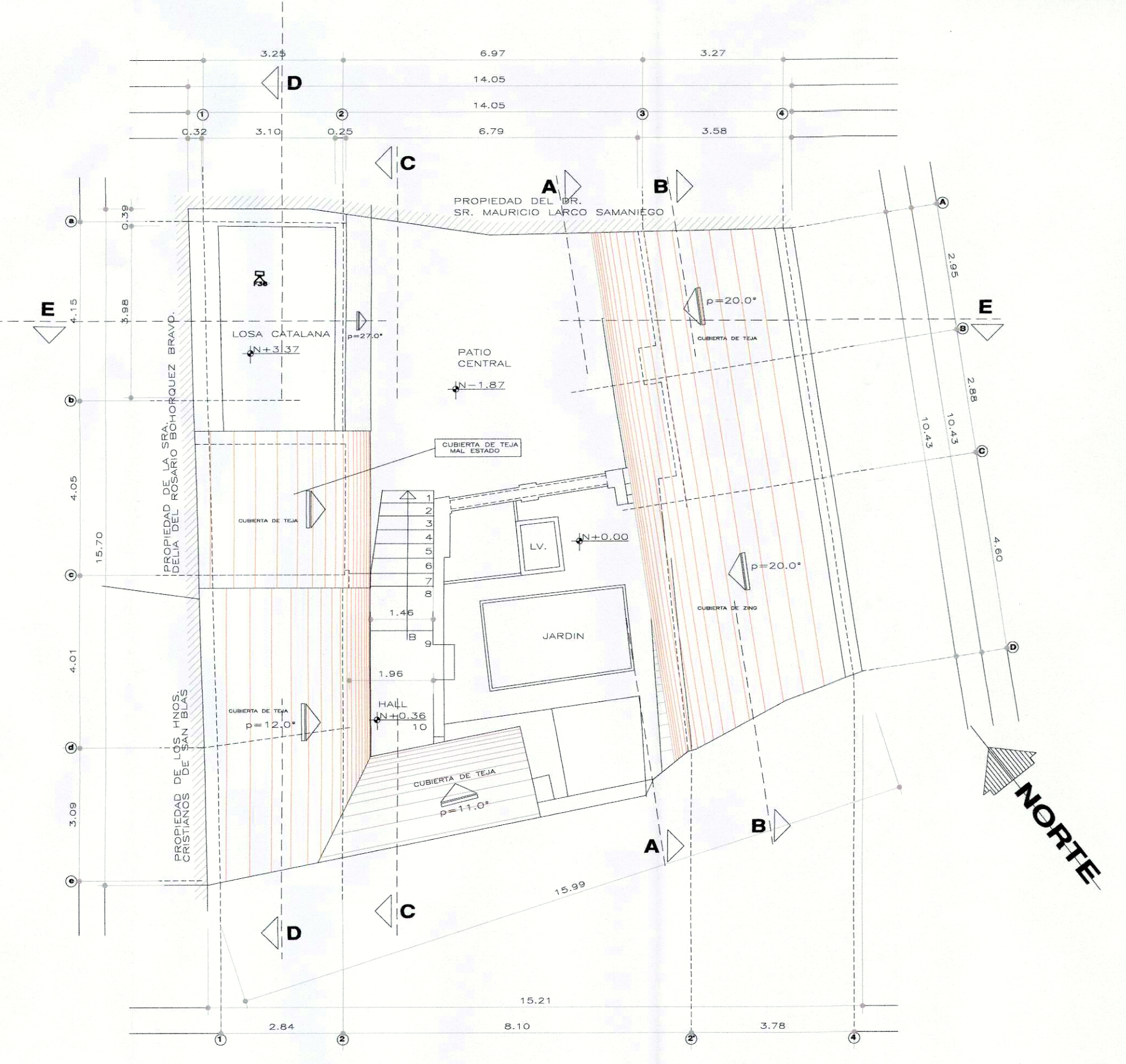
IMPLANTACION Y CUBIERTAS ESCALA 1:100