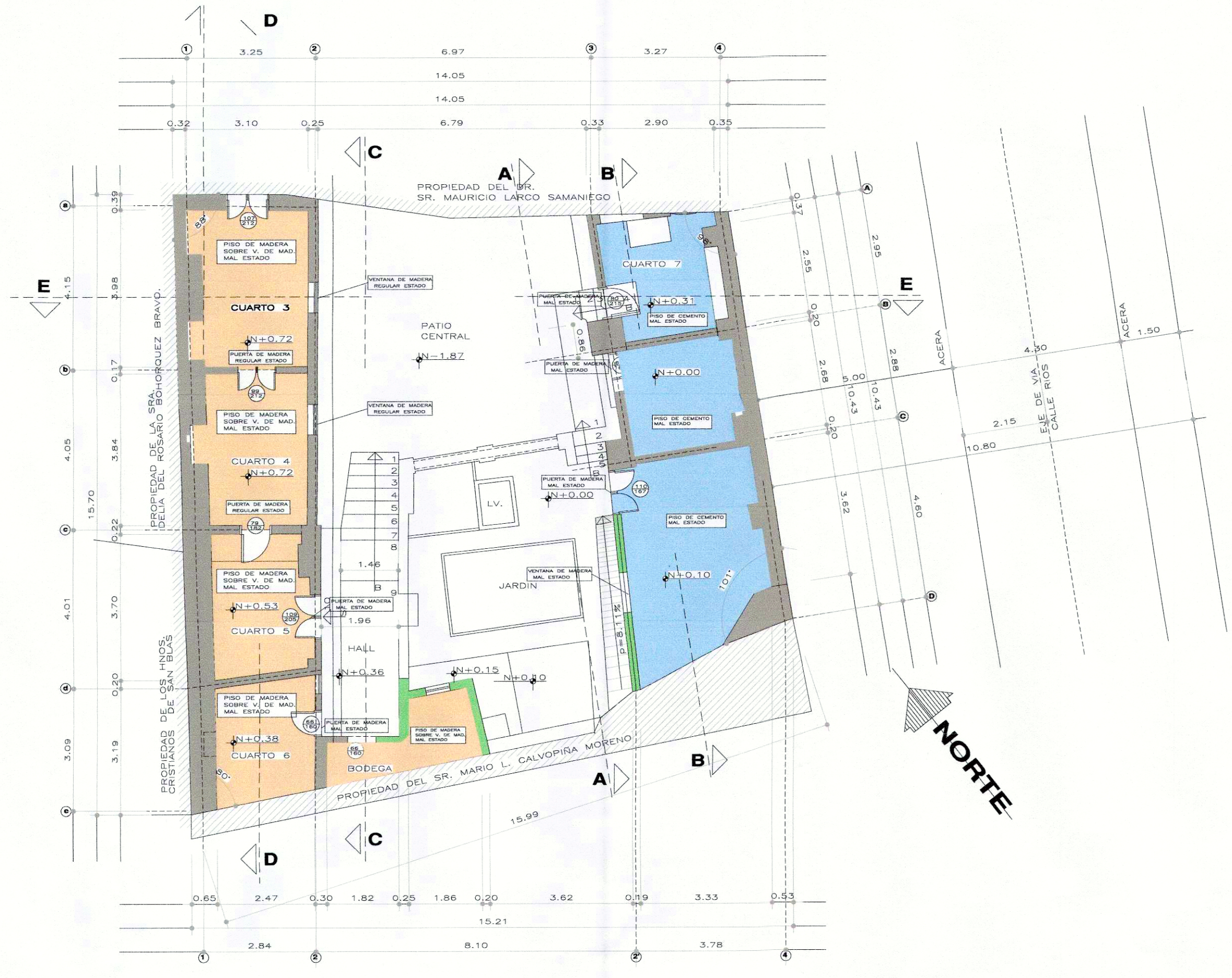
PLANTA BAJA N+0.00 Y N+0.72 ESCALA 1:100