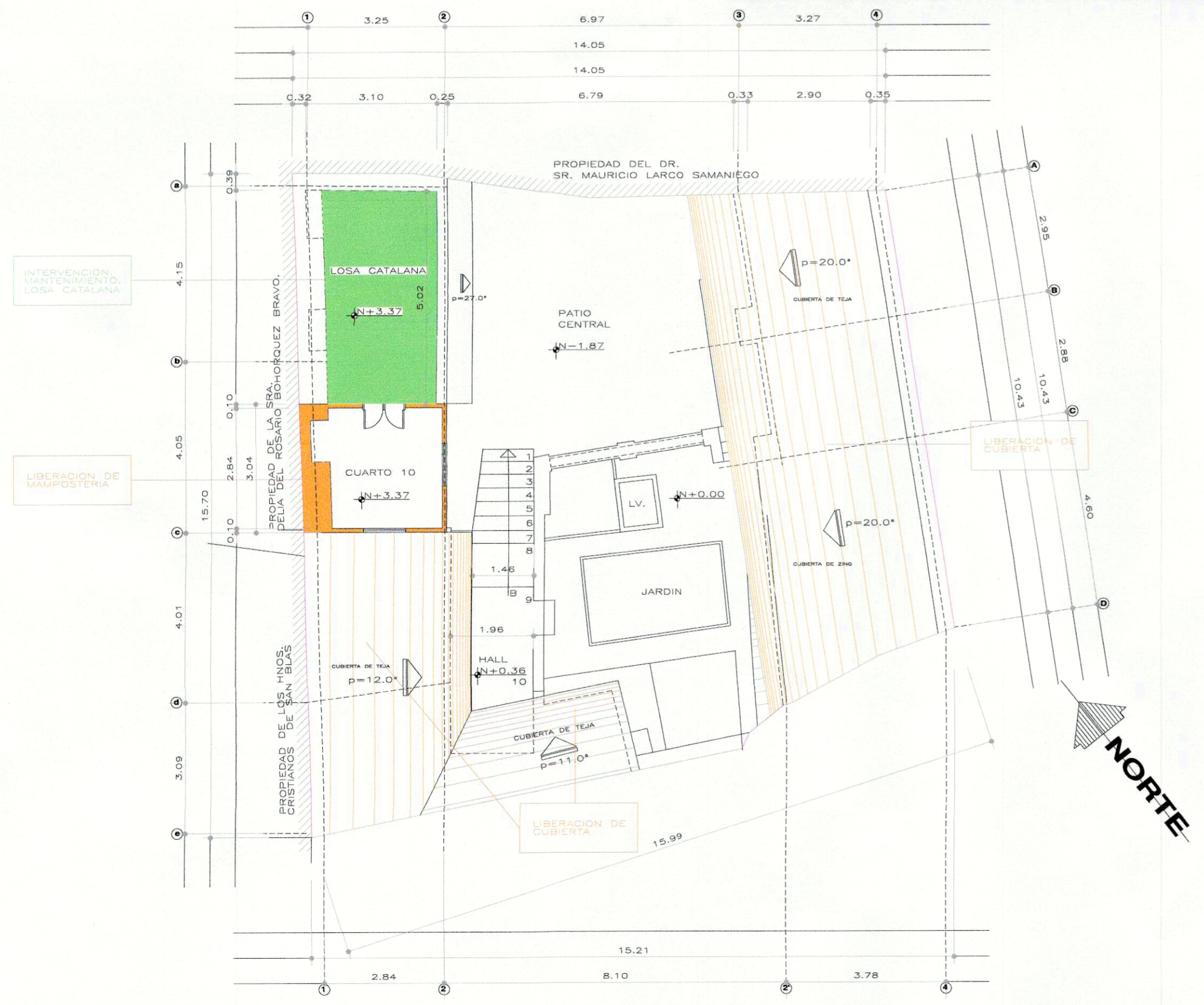
PLANTA PRIMER PISO N+3.37 ESCALA 1:100