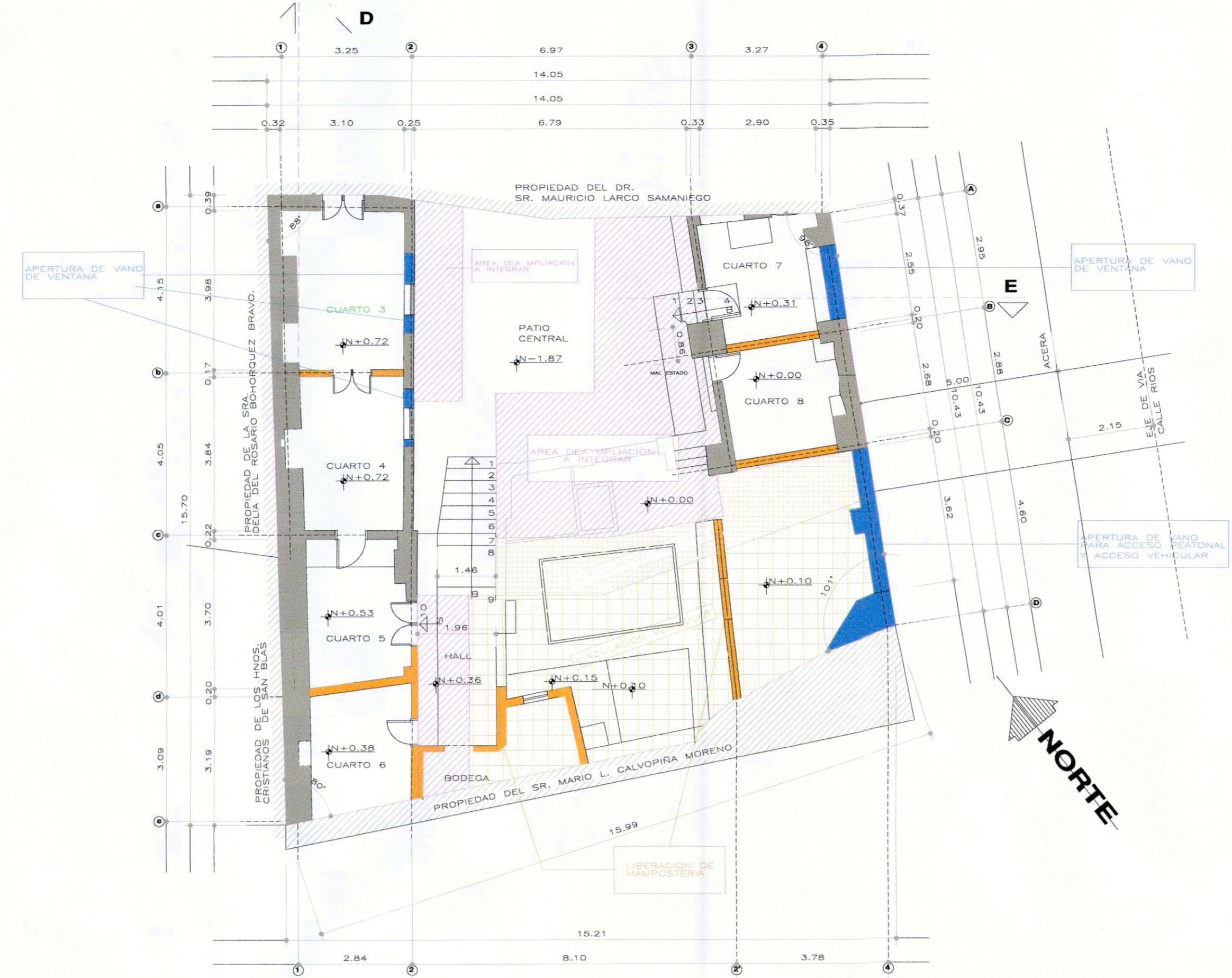
PLANTA BAJA. N+0.00 Y N+0.72 ESCALA 1:100