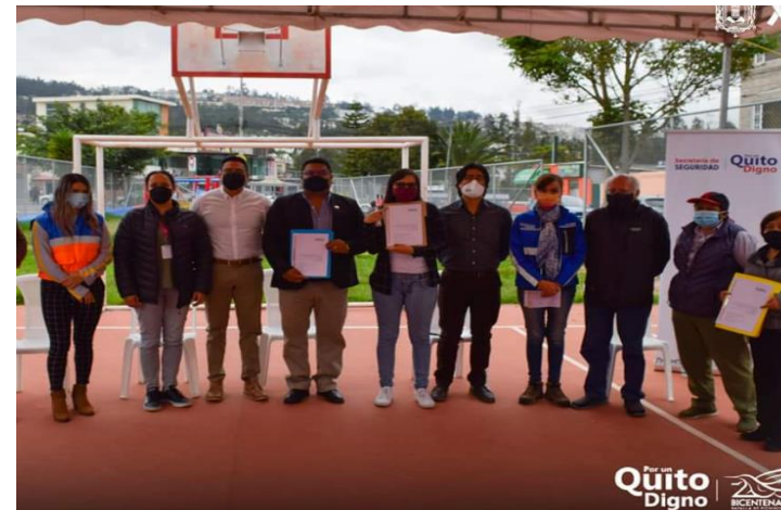
Foto No.2. Socialización y entrega del Plan de Acción de la zona 16- Sector Puertas del Sol- Quebrada Carretas