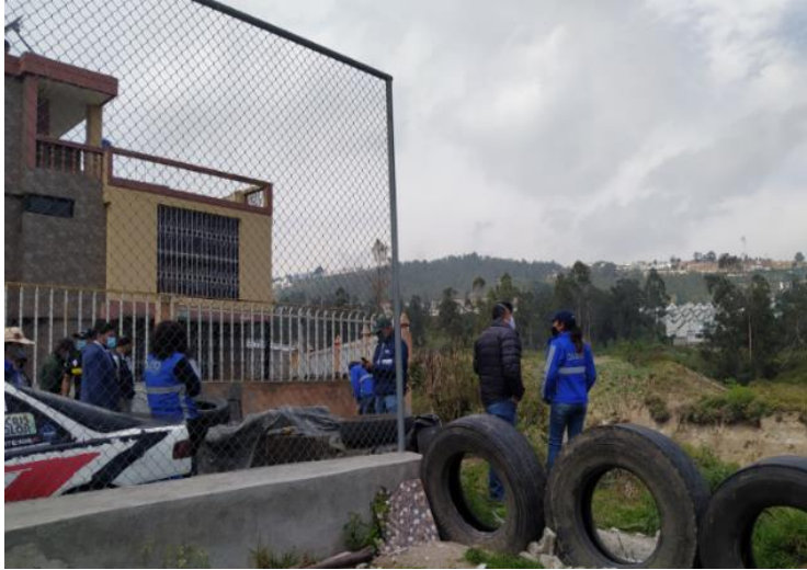
Foto No. 1: Inspección interinstitucional zona 16- Barrio Puertas del Sol Q. Carretas.