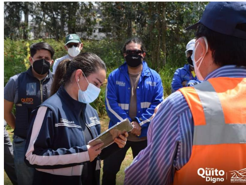
Foto No. 3: La Vicealcaldesa del DMQ, convocó a las entidades metropolitanas para revisar el avance del Plan de Acción.

La SGSG, presentó los avances de las obras de dicho Plan.