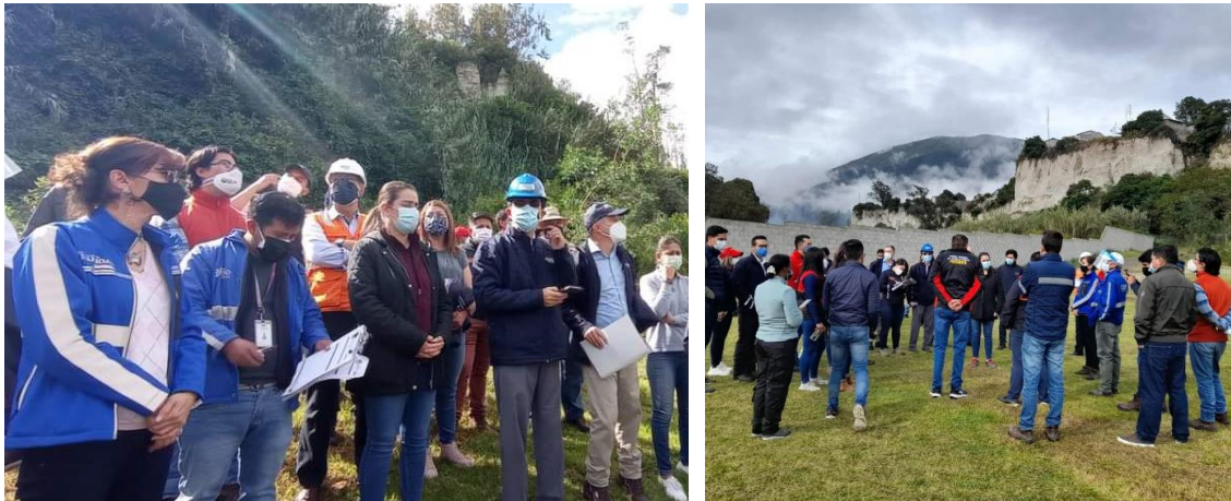
Fotografía 9. Recorrido interinstitucional zonas 6, 7, 11,12; 13-01-2022