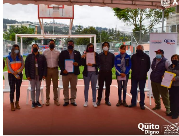
Fotografía 6. Socialización y entrega del Plan de Acción de la zona 16- Sector Puertas del Sol- Quebrada Carretas