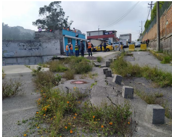
Fotografía 8. Inspección interinstitucional zona 1- La Esperanza-30-12-2021