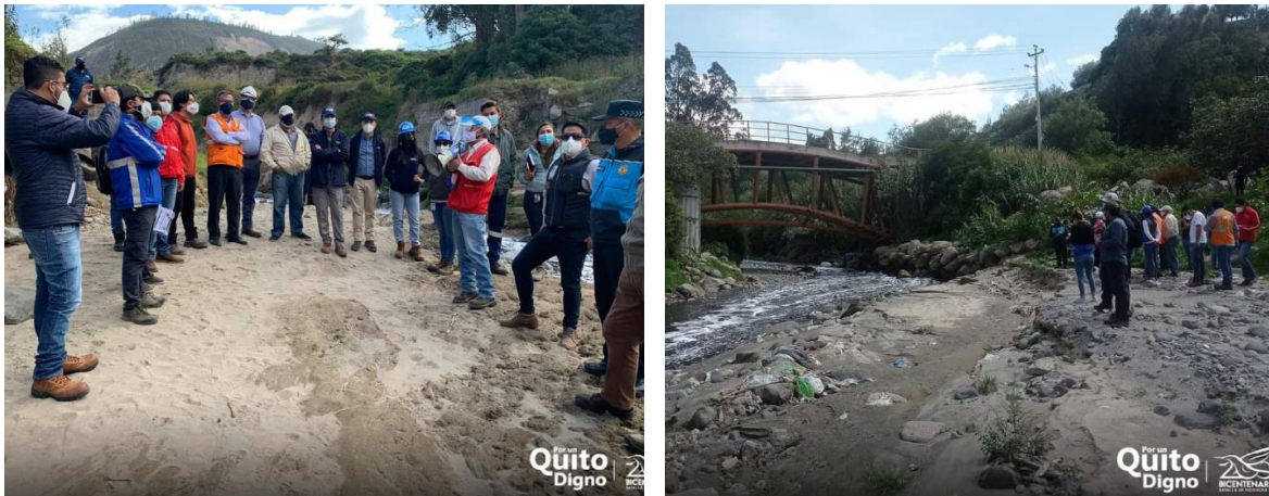
Fotografía 10. Recorrido interinstitucional zonas 5, 14 y 15 ; 20-01-2022