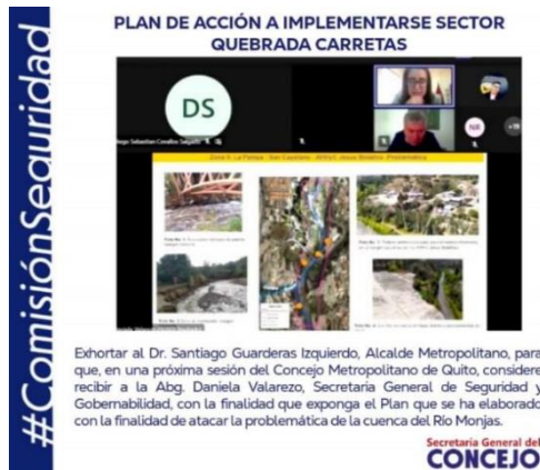
Fotografía 3. Presentación del Plan de Acción a la Comisión de Seguridad Ciudadana y Gestión de Riesgos.