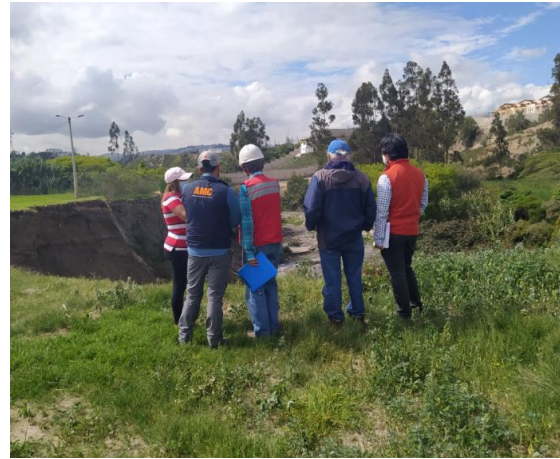
Fotografía 7. Inspección interinstitucional zona 13- Casa de Campo-10-12-2021