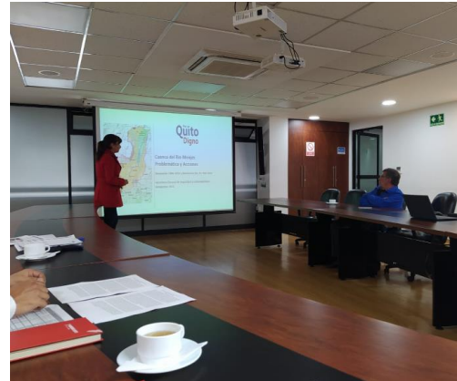
Fotografía 2. Presentación del Plan de Acción al Alcalde Metropolitano, participa EPMMOP, EPMAPS y SGSG