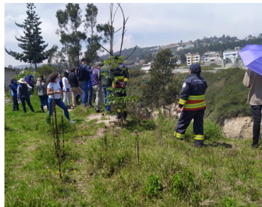
Fotografía 5. Inspección interinstitucional zona 16- Barrio Puertas del Sol Q. Carretas.