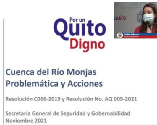
Fotografía 4. Presentación del Plan de Acción al Concejo Metropolitano, participa EPMMOP, EPMAPS y SGSG