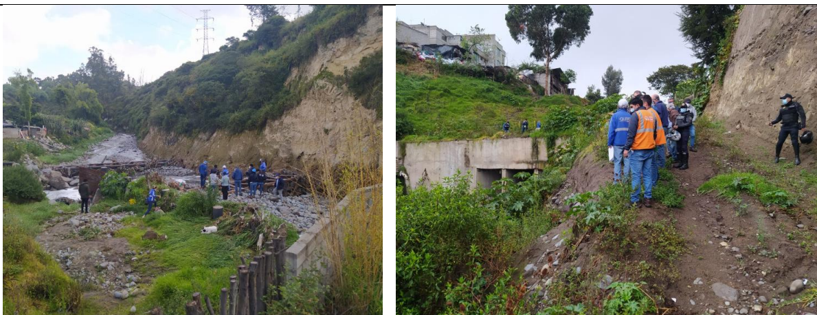
Fotografía 11. Recorrido interinstitucional zonas 1, 3 y 16; 27-01-2022