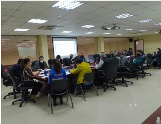
Fotografía 1 Reunión interinstitucional en las instalaciones del COE-M.