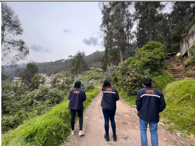
Imagen N°11: Pasaje La Comuna, no se evidencian procesos constructivos.