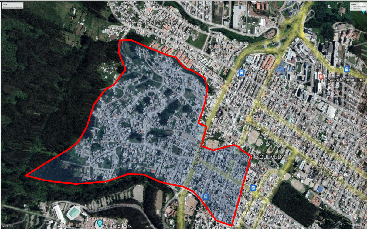
Imagen N°3 . Vista satelital año 2021