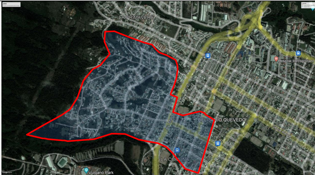
Imagen N° 2 . Vista satelital año 2018