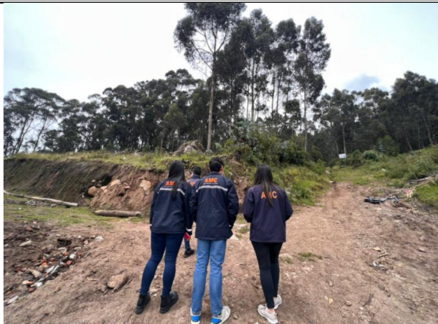
Imagen N°5: Calle Humberto Albornoz. No existen procesos constructivos.