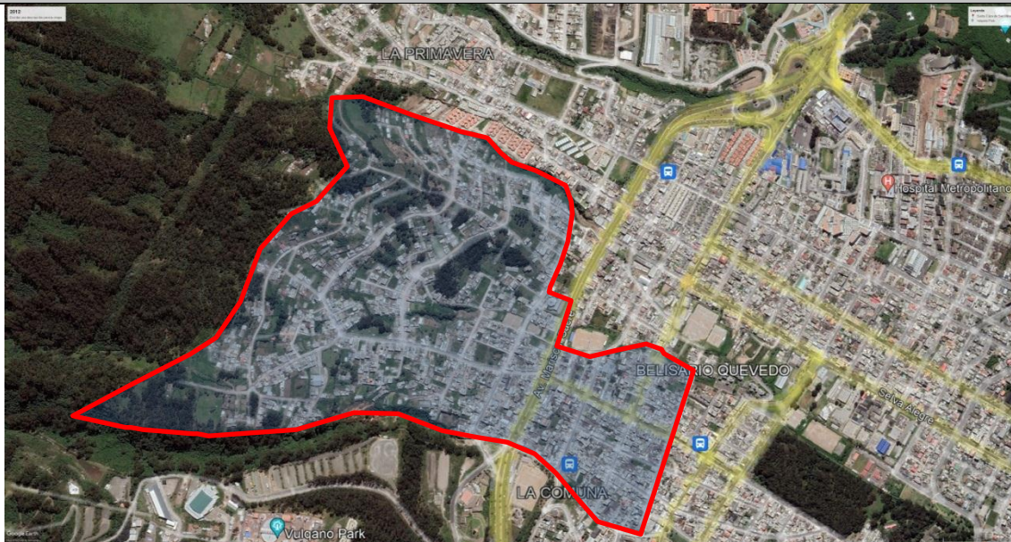
Imagen N° 1 . Vista satelital año 2012