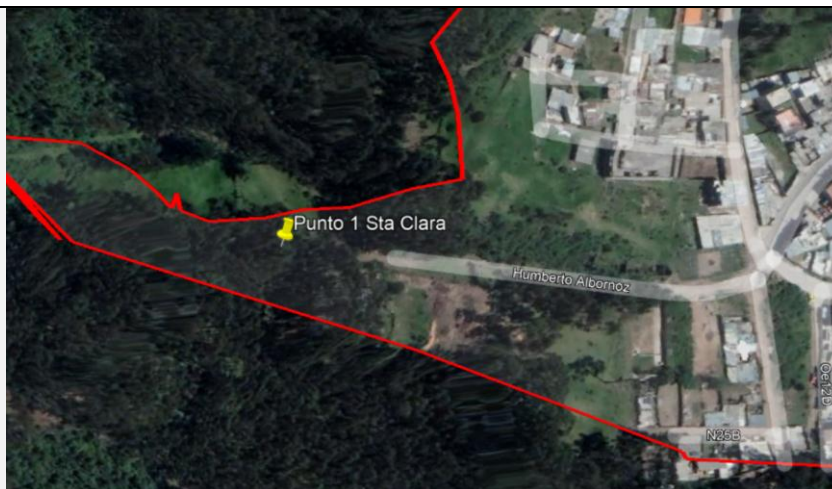
Imagen N°4: Punto uno de inspección. Calle Humberto Albornoz