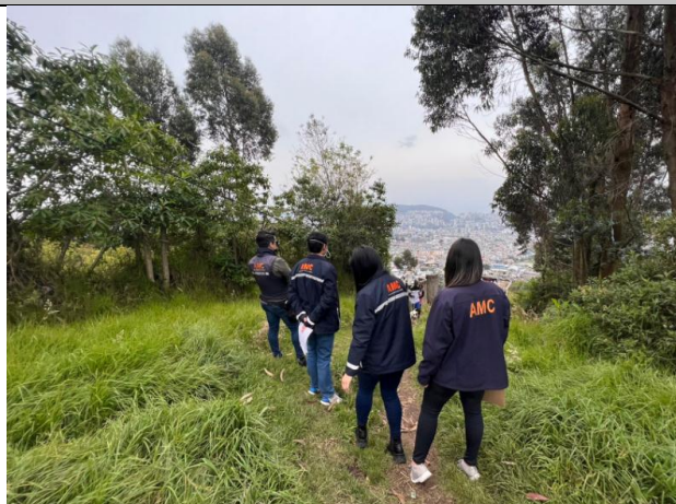
Imagen N°9: Calle N26D.