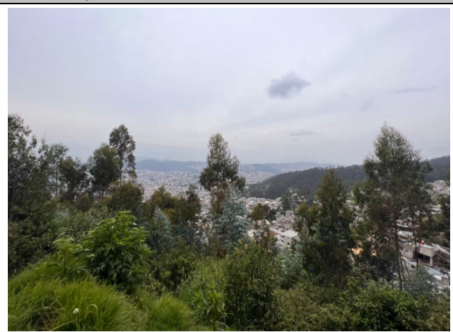
Imagen N°12: Pasaje La Comuna.