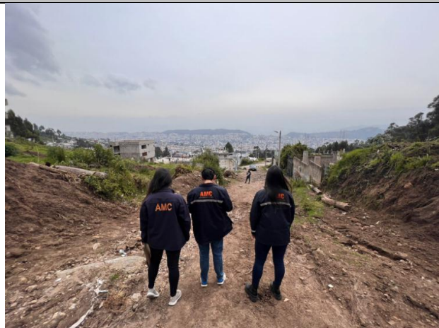
Imagen N°6: Calle Humberto Albornoz.