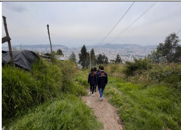
Imagen N°8: Calle N26D no se evidencian procesos constructivos.