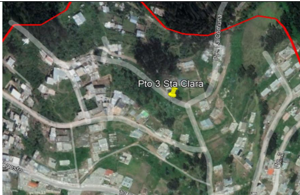
Imagen N°10: Punto tres de inspección. Pasaje La Comuna.