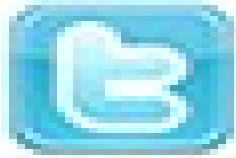
Twitter.png 3 KB