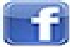
Facebook.png 3 KB