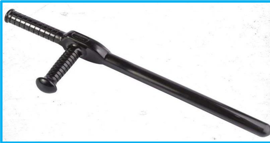
TOLETE PR 24