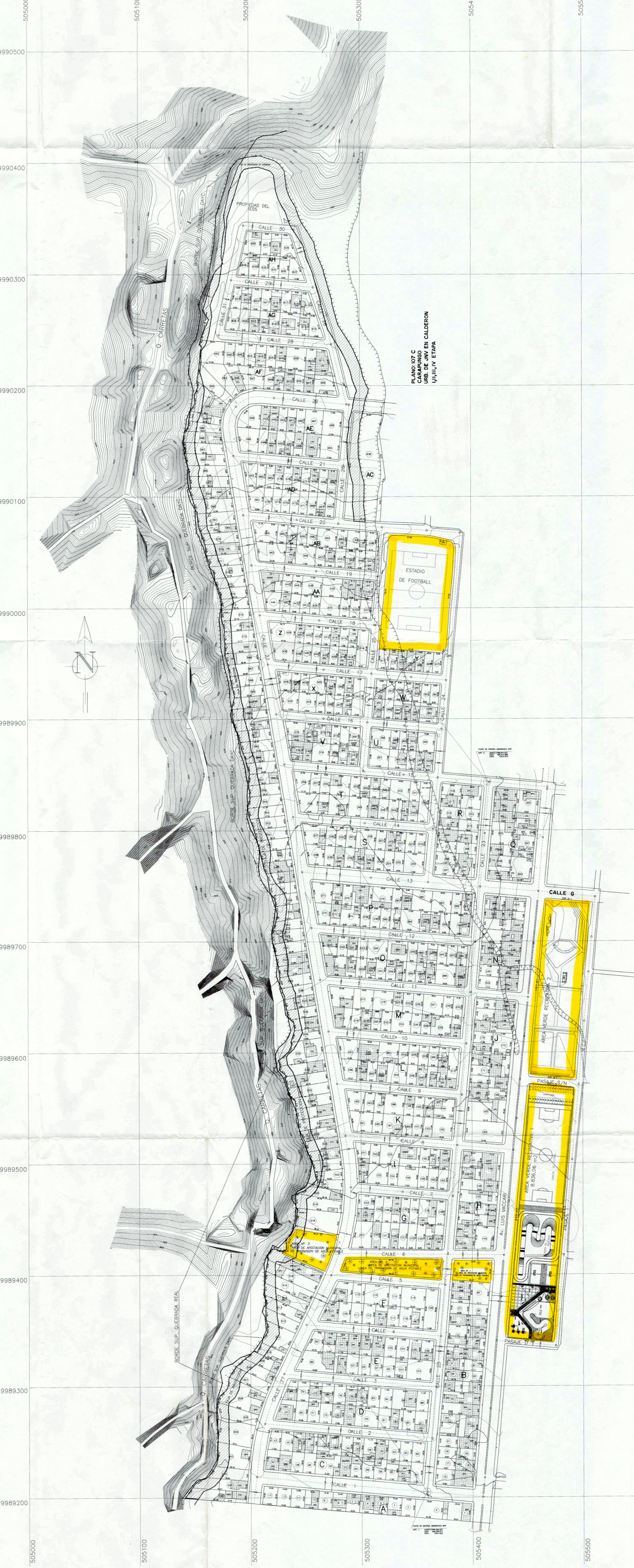
IMPLANTACION GENERAL DE LA COOP. DE VIV. PUERTAS DEL SOL ESCALA 1:1150