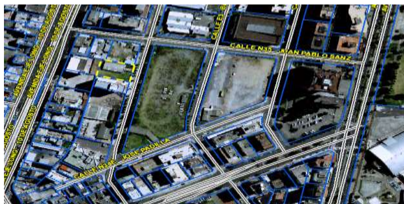
Gráfico No. 1

Zona Metropolitana: EUGENIO ESPEJO Parroquia: IÑAQUITO Barrio/Sector: LA CAROLINA Dependencia administrativa: ADMINISTRACIÓN ZONAL EUGENIO ESPEJO