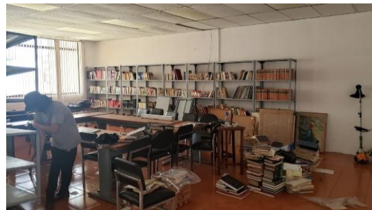
Fotografía 6 área de biblioteca