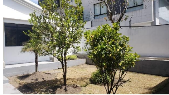
Fotografía 2 áreas exteriores