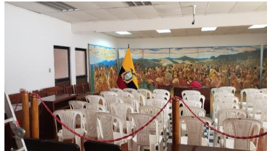
Fotografía 4 sala multiuso