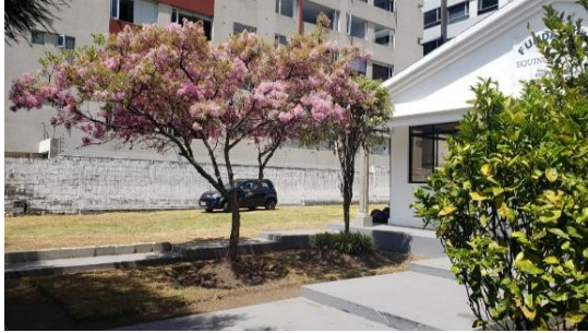
Fotografía 1 áreas exteriores