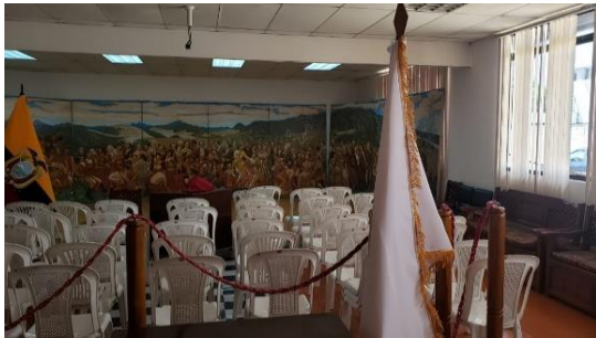
Fotografía 3 sala multiuso