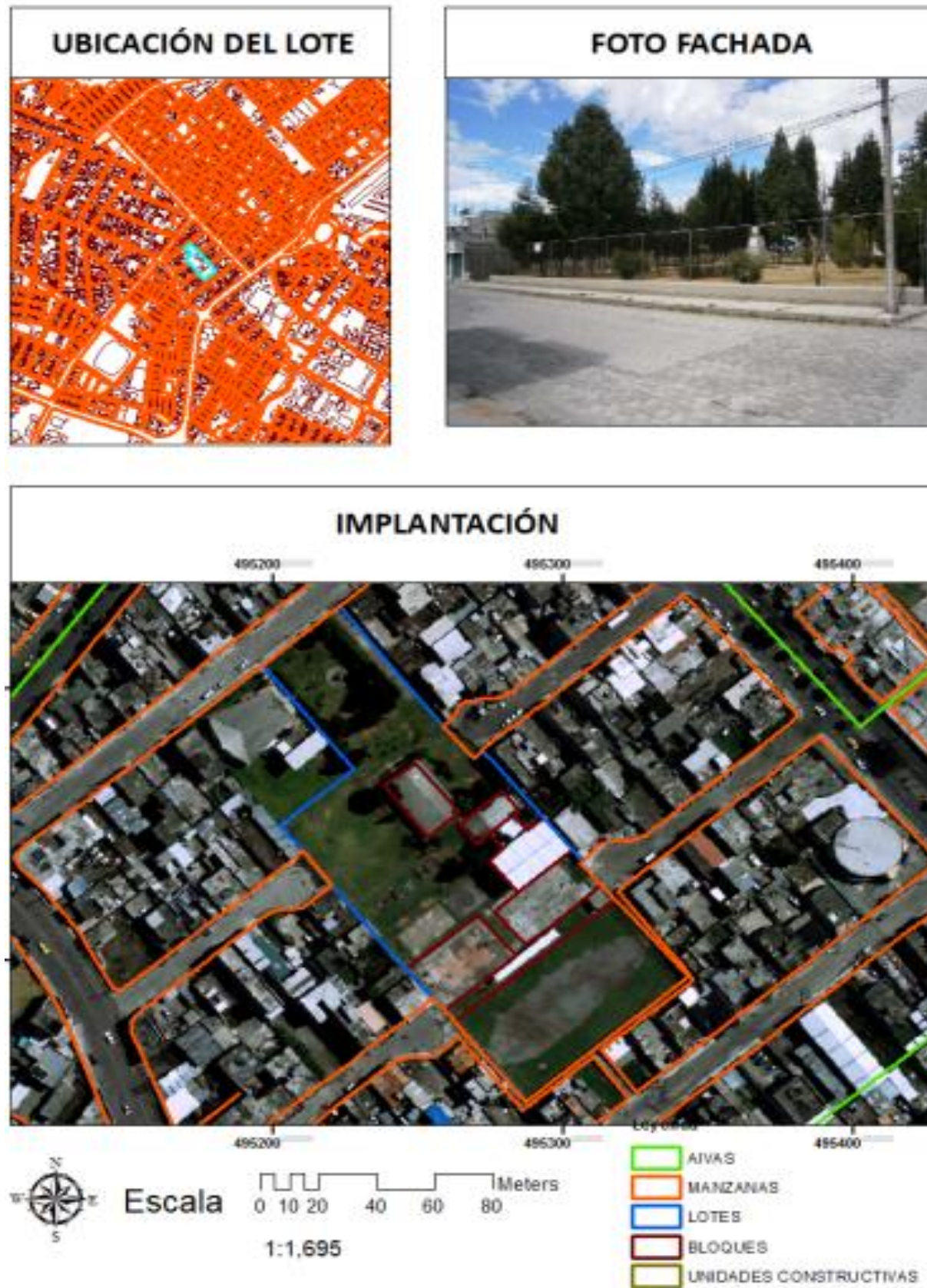
IMAGEN FICHA PREDIAL

La información consignada en el catastro es de entera responsabilidad del (de los) titular(es) y le(s) corresponde solicitar el ingreso o rectificación de cualquier información que considere(n) errónea o faltante, con los respectivos respaldos de acuerdo al marco normativo vigente. La información presentada no tiene incidencia respecto del régimen jurídico de la propiedad del bien inmueble. Conforme a la ley, corresponde al registrador de la propiedad certificar su titularidad de dominio. El catastro no da ni quita derechos sobre el dominio de los bienes inmuebles. La información presentada en la valoración especial corresponde a la Resolución No. con fecha . Por los motivos expuestos, no es procedente ni legal que esta ficha sea utilizada con fines distintos a los tributarios, ni para legalizar urbanizaciones o subdivisiones. Tampoco autoriza trabajo alguno en el bien inmueble, ni certifica compatibilidad de uso del suelo. La información presentada ha sido revisada en el catastro predial hasta el Tuesday, August 09, 2022 y tiene una validez de 60 días salvo que se haya realizado alguna actualización catastral.