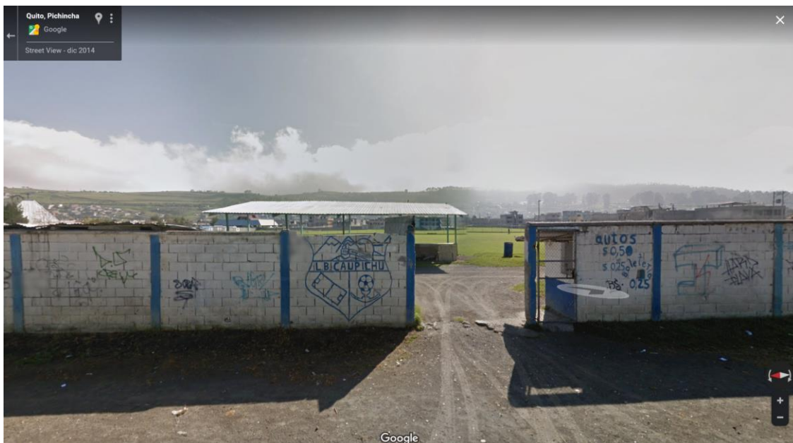
Imagen de Google Maps del predio solicitado