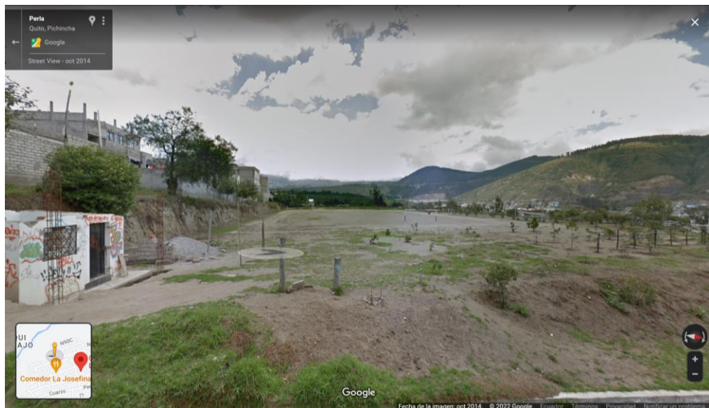
Imagen de Google Maps del predio solicitado