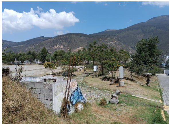
Fotografía 3: Vista hacia el lindero Este, calle Oe3, lugar en el cual existen las baterías sanitarias en estado de deterioro.