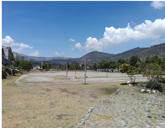
Fotografía 1: Vista exterior hacia las especies naturales y canchas de voley y cancha de fútbol de uso público.