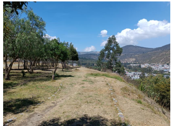
Fotografía 4: Vista hacia el lindero Norte. Quebrada de protección.