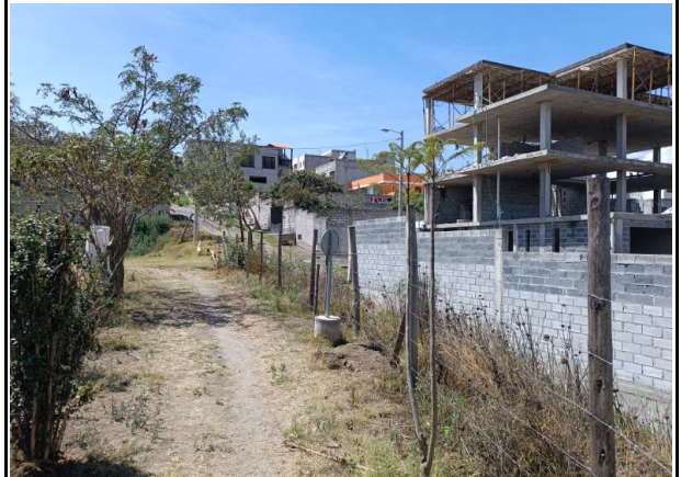
Fotografía 2: Vista hacia el lindero Oeste, calle Oe3E, áreas verdes.