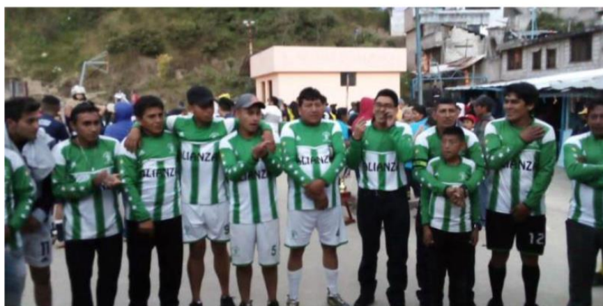
Imágenes de actividades deportivas