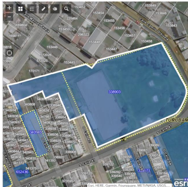
Imagen de Google Maps del predio solicitado