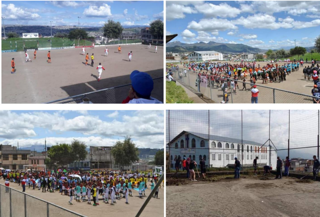
Imágenes de actividades deportivas