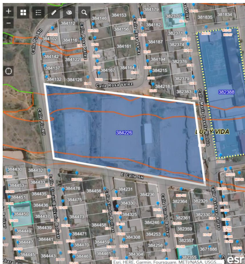
Imagen de Google Maps del predio solicitado