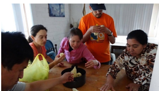
Imagen 12: Actividades que promueven la vida independiente