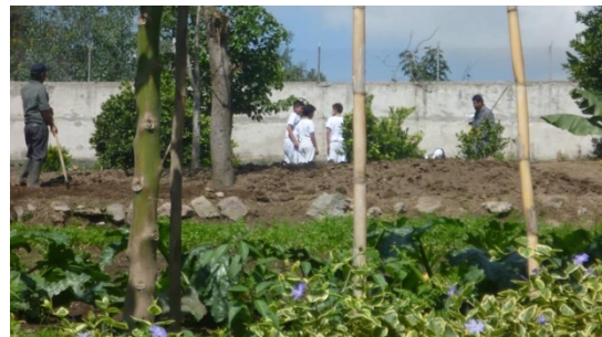
Imagen 3: Vista General espacio de cultivos