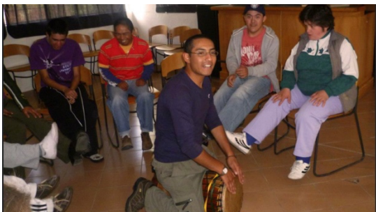
Imagen 4: Talleres enfocados a la vida autónoma e independiente