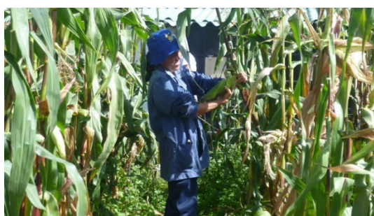
Imagen 9: Trabajos en el huerto