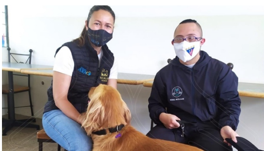
Imagen 8: Trabajo de reducción de ansiedad mediante ayuda de canes