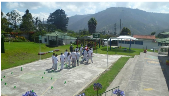
Imagen 2: Vista general del complejo donde funciona FINE