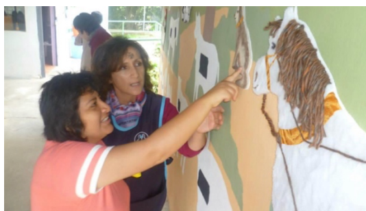
Imagen 11: Uso de tableros sensoriales