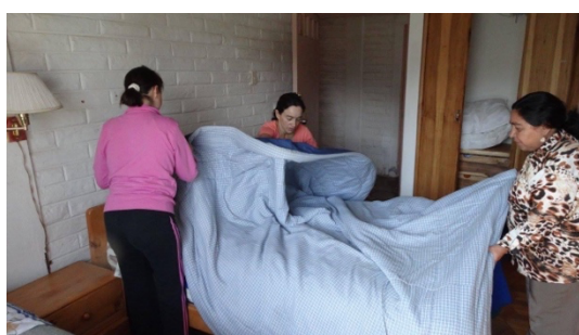
Imagen 13: Actividades que promueven la vida independiente