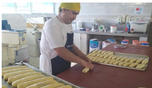
Imagen 7: Talleres de panadería