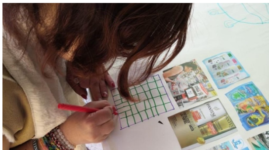
Imagen 5: Talleres de dibujo y pintura