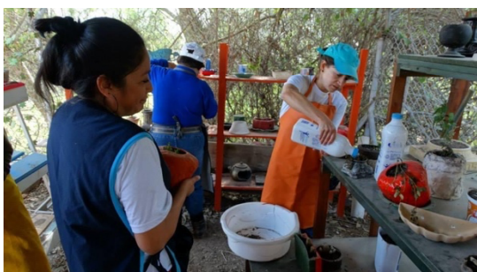
Imagen 10: Talleres de jardinería