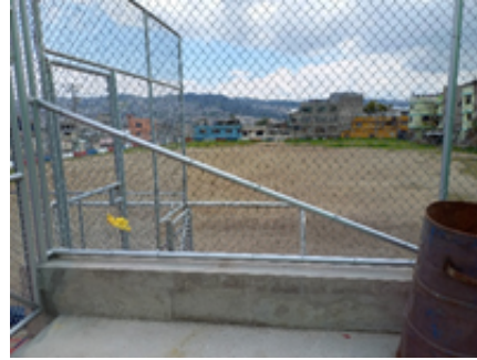
Cancha de futbol ubicada en el lindero sur