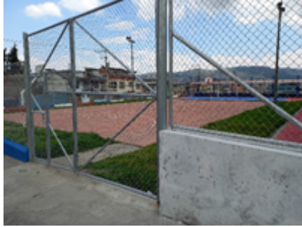
Cancha de uso múltiple