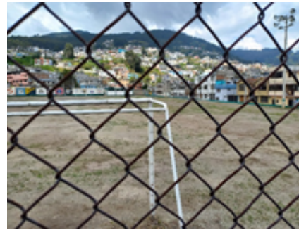
Tribuna y Baterías Sanitarias, Cancha y Graderío de malla Cancha de futbol con cerramiento de malla