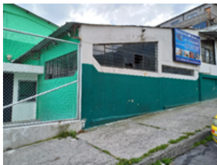
Sede Social de la liga planta baja