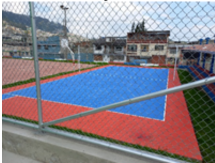
Cancha de vóley