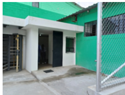
Fisioterapia en la planta alta