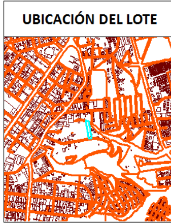
IMAGEN FICHA PREDIAL