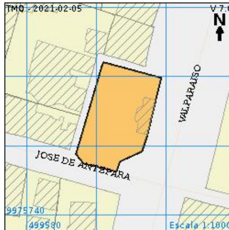
Gráfico 1: Ubicación del lote con predio 779560

Área según escritura: 547.13 m 2 Área gráfica: 496.60 m 2 Frente total: 92.62 m Máximo ETAM permitido: 10.00 % = 54.71 m 2 [SU] Zona Metropolitana: CENTRO Parroquia: CENTRO HISTÓRICO Barrio/Sector: SAN BLAS