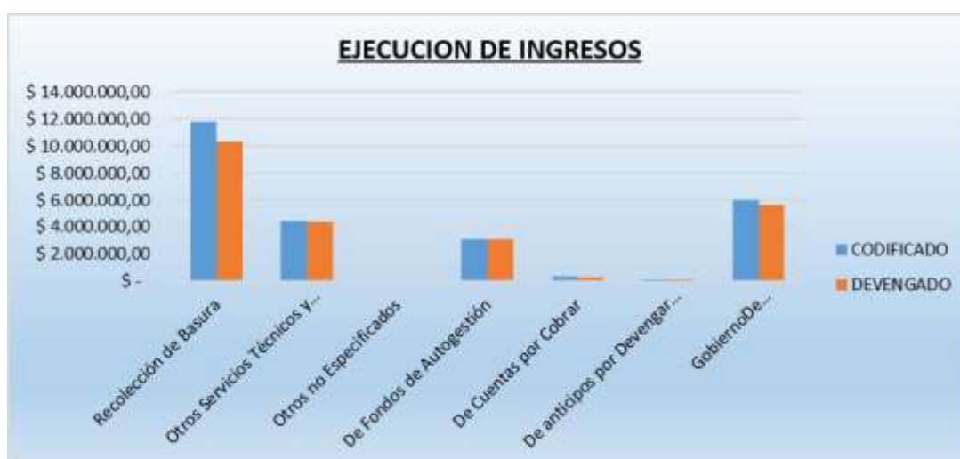
Grafico 2 Ejecución de Ingresos

Fuente: Sistema ERP. Elaborado por: Rosa Calahorrano