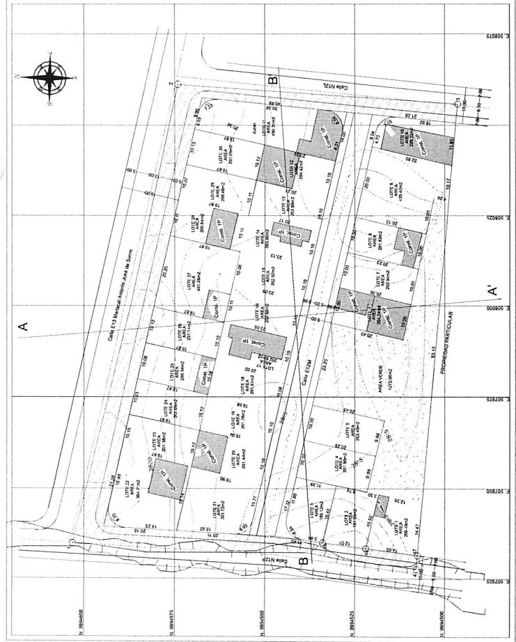
LEVANTAMIENTO TOPOGRAFICO Escala: 1:500 ELIPSOIDE TMQ WGS 84