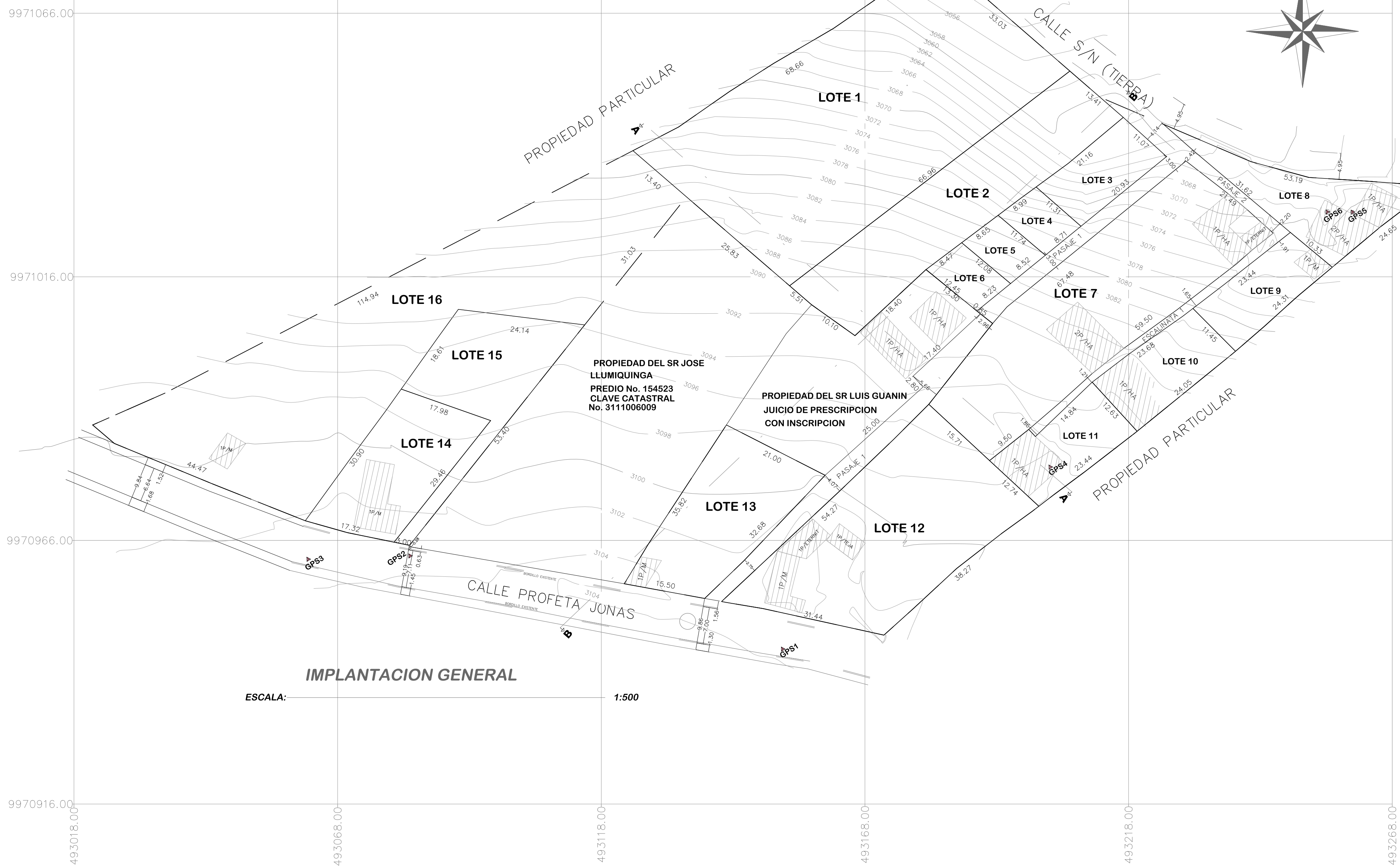
IMPLANTACION GENERAL ESCALA: 1:500