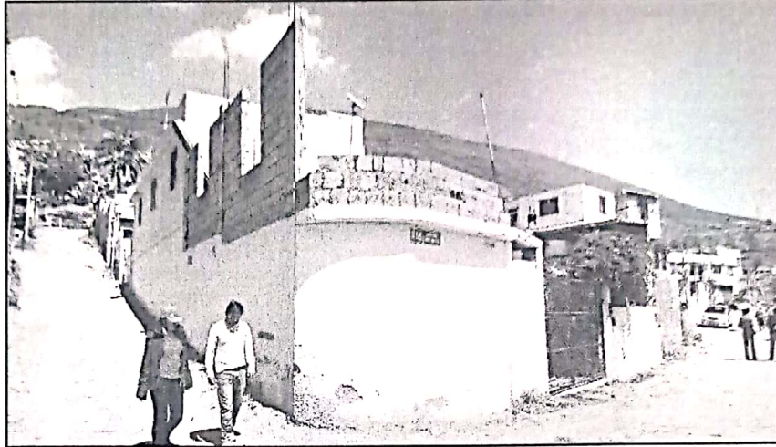
Foto 1 Calle Antonio Astudillo