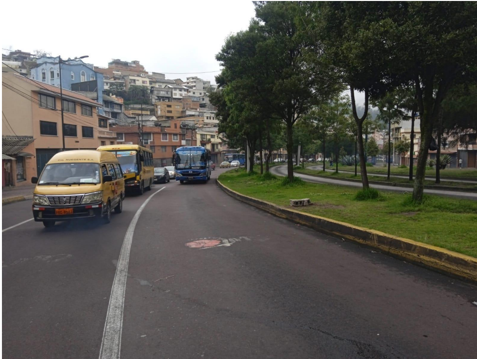
Av. Pichincha Sur-Norte 07h00 Escolares e Institucionales atrapados en la congestión mientras el carril exclusivo se encuentra vacío.