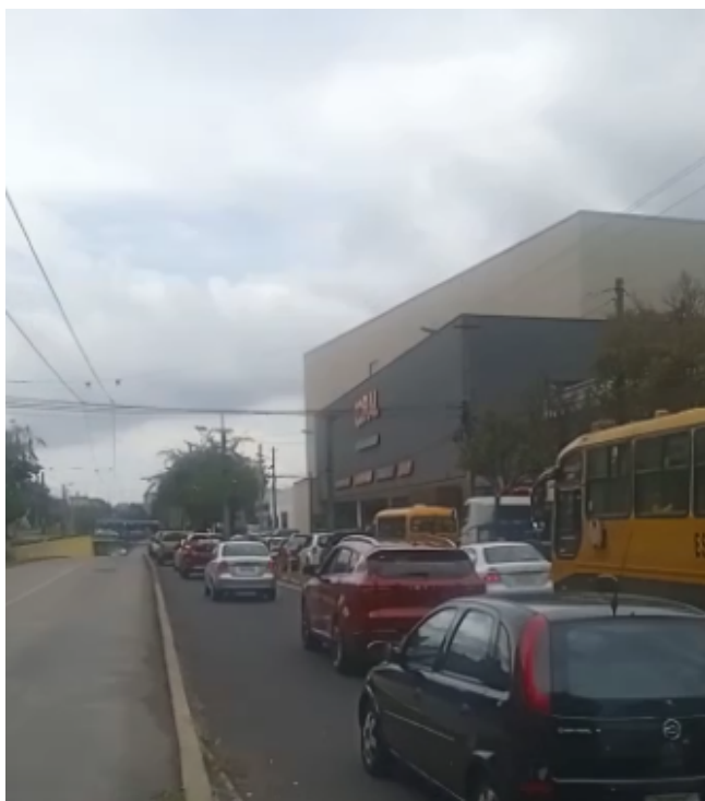
Av. 10 de Agosto Intercambiador de la Y 14h30 Sur-Norte Escolares atrapados en el tráfico mientras el carril exclusivo se encuentra vacío.