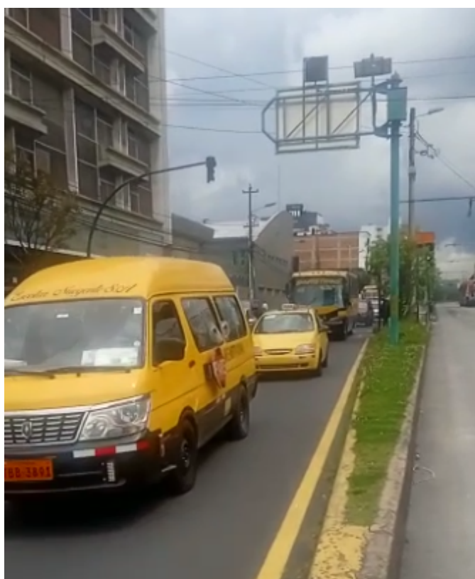
Av. 10 de Agosto y Naciones Unidas 14h30 Sur-Norte Taxis y Escolares atrapados en el tráfico mientras el carril exclusivo se encuentra vacío.