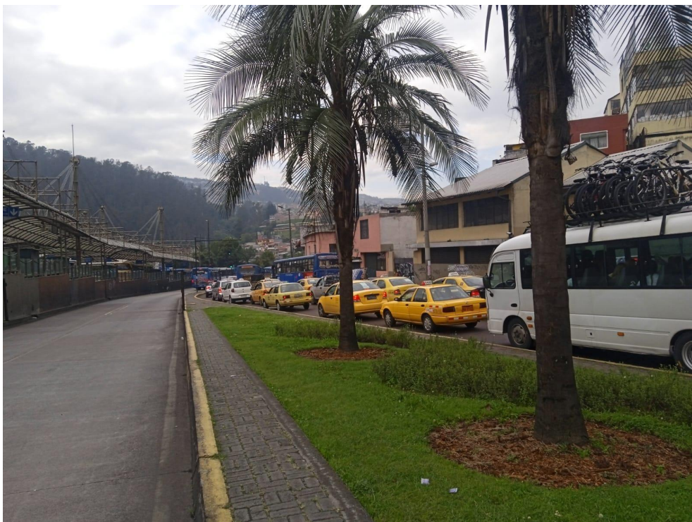
Av. Pichincha Norte-Sur 16h00 Taxis atrapados en la congestión mientras el carril exclusivo se encuentra vacío.