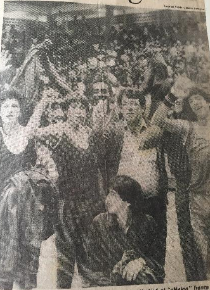
La selección masculina de básquetbol de Pichincha se adjudicó el "clásico" frente