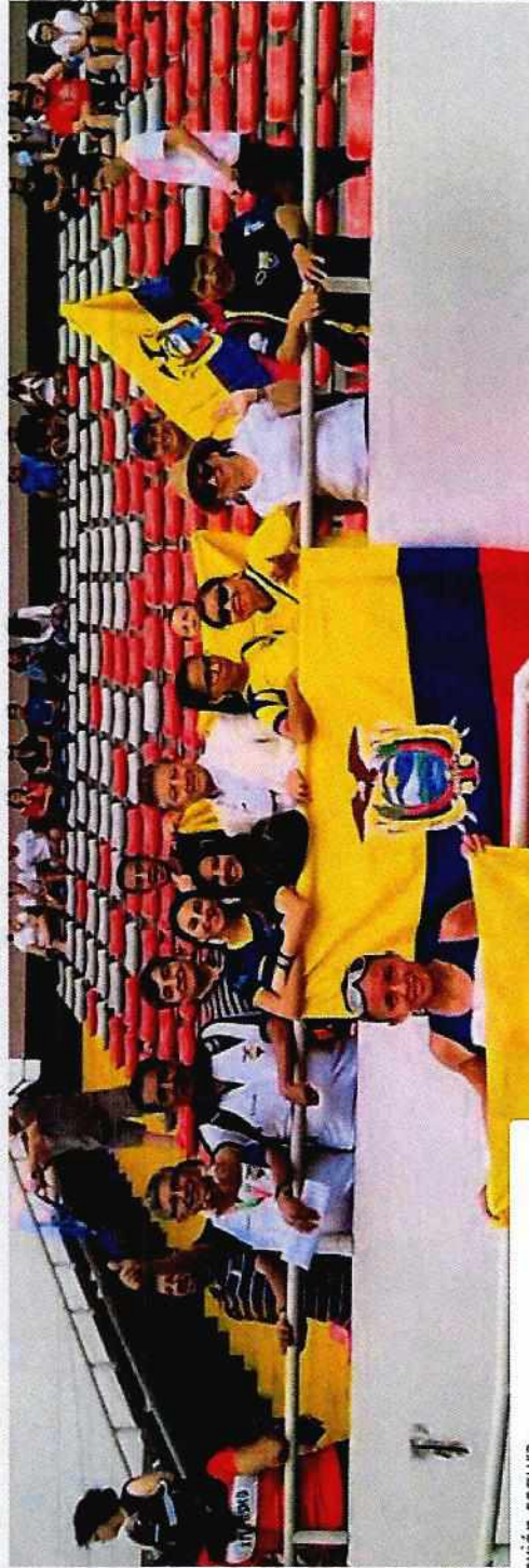
Estableciendo renovación renueva