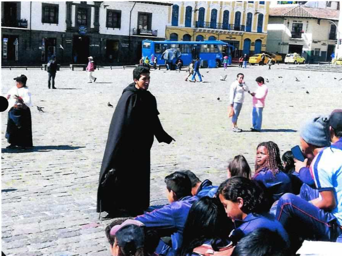
Explicando la Historia de la Iglesia de San Francisco al Bachillerato de la Unidad Educativa Leónidas Plaza Gutiérrez