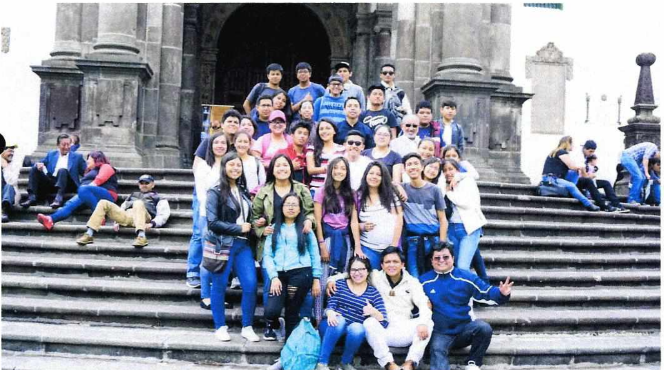
Primer recorrido el 27 de diciembre del 2018