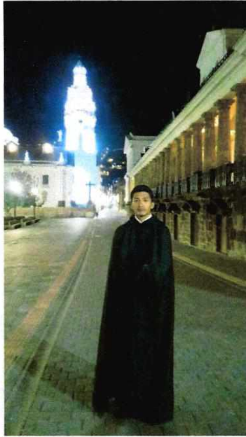
El traje del Peregrino de Quito