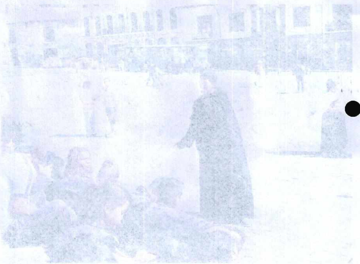
Reunião com crianças e jovens do bairro de San Francisco