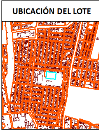
IMAGEN FICHA PREDIAL