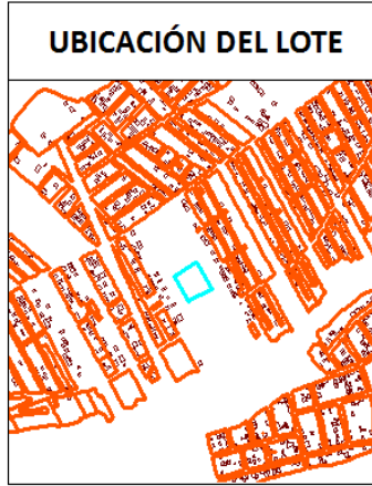
IMAGEN FICHA PREDIAL