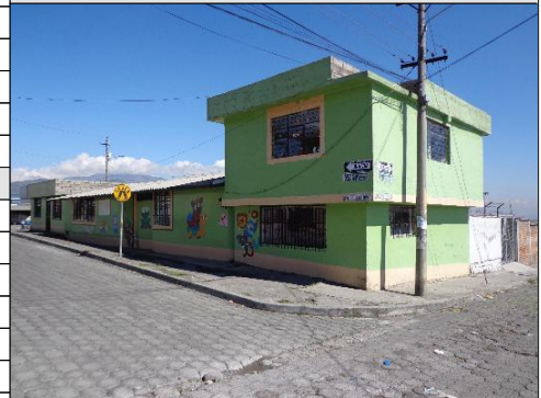
FOTOGRAFÍA DE LA FACHADA

DATOS DEL LOTE Clasificación del suelo: Suelo Urbano Clasificación del suelo SIREC-Q: URBANO Área según escritura: 542.27 m2 Área gráfica: 494.08 m2 Frente total: 44.73 m Máximo ETAM permitido: 10.00 % = 54.23 m2 [SU] Área excedente (+): 0.00 m2 Área diferencia (-): -48.19 m2 Número de lote: - Dirección: S46A JOAQUIN ENRIQUEZ - S45-343 Zona Metropolitana: QUITUMBE Parroquia: LA ECUATORIANA Barrio/Sector: LA ECUATORIANA