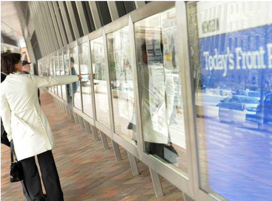
Museo de la Comunicación en Washington