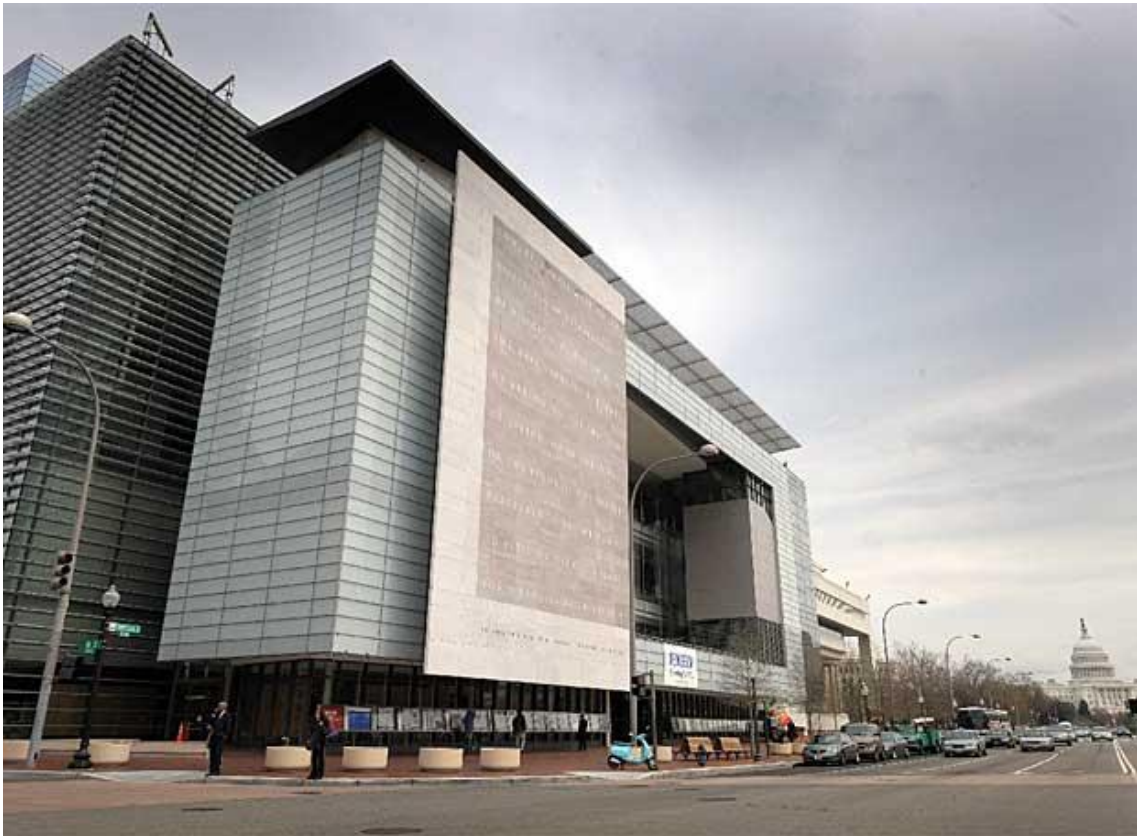
Museo de la Comunicación en Washington.