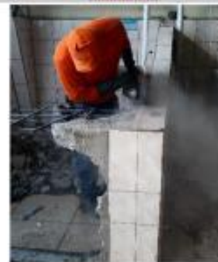
Descripción: CORTE DE ADOQ. ACERA Y ASFAL. CON DISCO DIAMANTE (Conocoto)