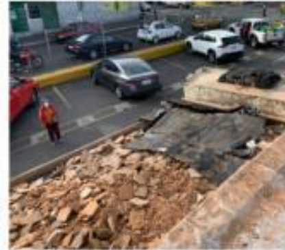
Descripción: DESALOJO ROTURA CERAM.