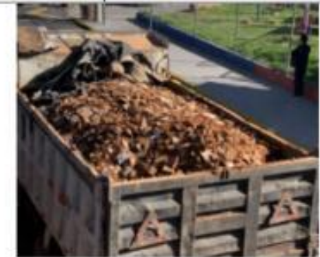
Descripción: DESALOJO ROTURA CERAM