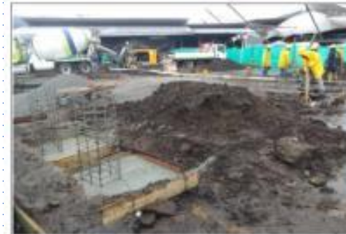
Descripción: FUNDICIÓN DE PLINTOS ÁREA DE CUBIERTA