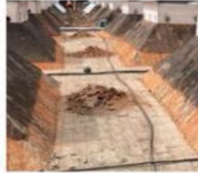
Descripción: ROTURA DE BALDOSA