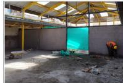
Descripción: CERRAMIENTO SEDE SOCIAL