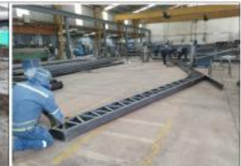
Descripción: ARMADO DE VIGAS Y COLUMNAS ÁREA DE CUBIERTA