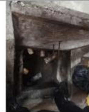
Descripción: levantamiento tapas cajas de revisión mercado Quinche