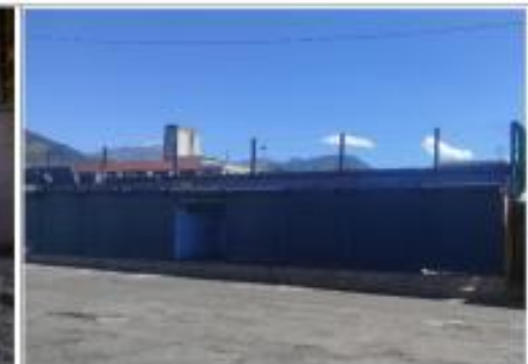
Descripción: RETIRO DE CUBIERTA METÁLICA ÁREA DE COSTURA