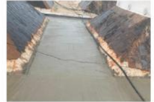
Descripción: MASILLADO LOSA