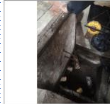
Descripción: levantamiento tapas cajas de revisión mercado Quinche