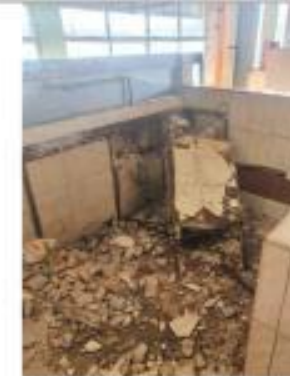
Descripción: DERROCAMIENTO HORMIGON ARMADO COLUMNA MESON MANUAL (Cotocollao)