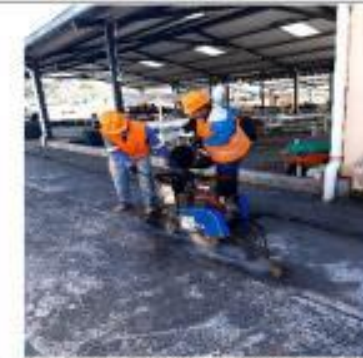
Descripción: CORTE DE ADOQ. ACERA Y ASFAL. CON DISCO DIAMANTE (Amaguaña)