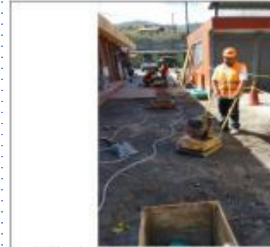
Descripción: Colocación de sub-base (Chiriyacu)