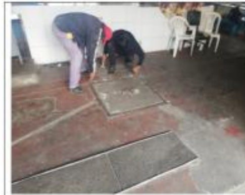
Descripción: levantamiento tapas cajas de revisión mercado Quinche