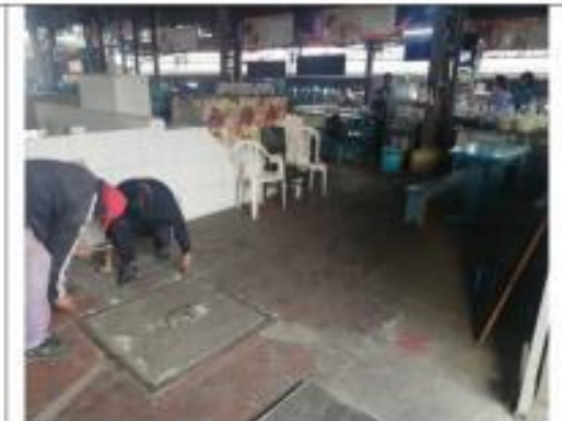
Descripción: levantamiento tapas cajas de revisión mercado Quinche